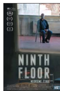
Canada / 2015 / 81 min

RÉAL. ET SCÉN. Mina Shum IMAGE John Price MUS. Brent Belke MONT. Carmen Pollard PROD. Selwyn Jacob DIST. Office national du film