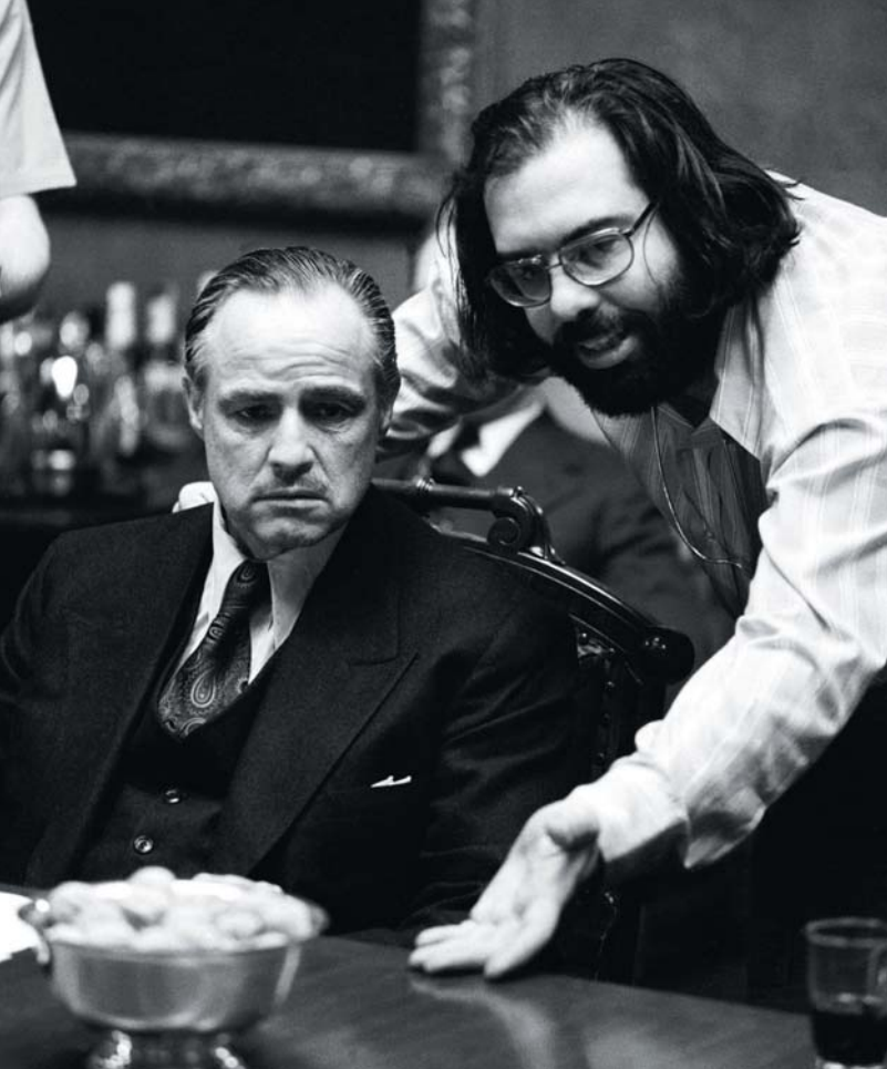
Francis Ford Coppola dirigeant Marlon Brando

la grande histoire de l'Amérique, ouvre la voie aux expérimentations scénaristiques des années 1990, avec Quentin Tarantino, David Fincher et Christopher Nolan, qui vont à leur tour manipuler les genres et la narration, toujours avec cette même tension entre film d'auteur et film grand public, tension que The Godfather a en partie instituée et, en fin de compte, déjouée — l'autre principal instigateur de cela demeure Alfred Hitchcock, dans la filmographie de qui se profilent également de tels éclats de génie pourtant produits à l'intérieur même du système hollywoodien.