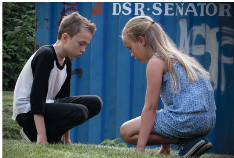
Mon dernier été

et consciencieux, montre peu, préférant s'attarder au regard de Tom. En plus de décupler la force dramatique de la scène, ce choix éthico-esthétique a le mérite de ne pas insister sur cette situation abjecte. Après tout, l'art et la morale ne sont pas nécessairement incompatibles.