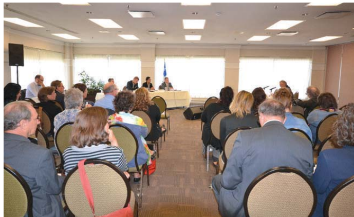
Audiences pour le renouvellement de la politique culturelle québécoise à Québec, Victoriaville, Laval et Rimouski