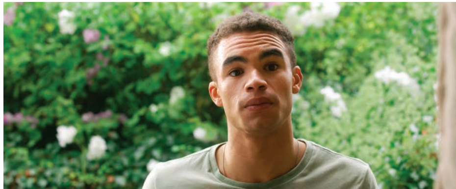
Nicolas Maury (Jérémie), Arnaud Valois (Albert) et Théo Christine (Kevin) dans Garçon chiffon

Vous vous mettez complètement à nu dans ce film comme acteur, mais aussi comme réalisateur. Vous dévoilez une très grande vulnérabilité. Est-ce que marcher sur un fil si mince vous a donné le vertige?