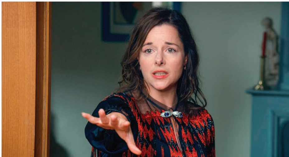
Laure Calamy dans une scène déjà culte

Voilà, c'est ça. Il y a comme un degré zéro, on dit souvent qu'il faut remonter en selle quand on s'est fait quitter. Jérémie va donc remonter en selle sans