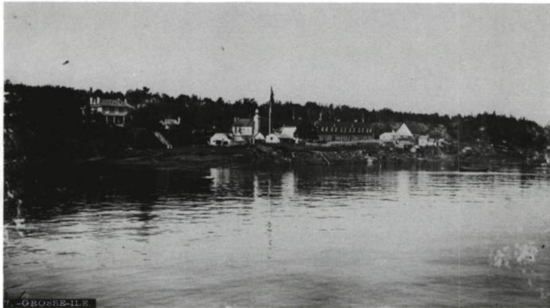
Vue générale de la Grosse Île à la fin du XIX e siècle.

cimetière des immigrants au XIX e siècle.