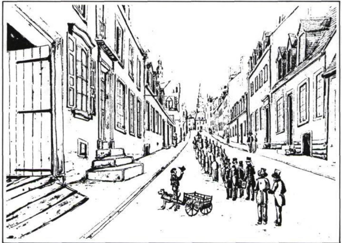
Procession funéraire se dirigeant vers l'église Notre-Dame de Québec à proximité du cimetière des picotés. Aquarelle de James P. Cockburn en 1830.

L' accroissement rapide du nombre de cimetières est l'une des caractéristiques importantes du développement urbain de Québec sous le Régime anglais. Aux mortalités naturelles s'ajoutaient celles causées par les épidémies que l'activité commerciale intense alliée à l'absence de pratique sanitaire favorisaient grandement. Le choléra frappa cinq fois entre 1832 et 1854. La typhoïde, la scarlatine, la diphtérie et la variole régnaient à l'état endémique.