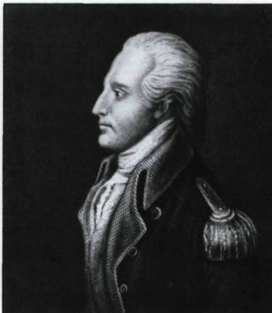
Portrait de Benedict Arnold (1741-1801), officier dans l'armée américaine.

Le chemin de fer fait enfin son entrée à Saint-Georges en 1907, ce qui facilite le transport du bois et favorisera l'industrialisation subséquente. Le projet de rendre le chemin de fer de la Beauce jusqu'aux États-Unis, en suivant la route Lévis-Jackman, est abandonné avec la faillite du Kennebec Railway. La nouvelle compagnie, le Québec Central, préfère relier Lévis aux États-Unis par les