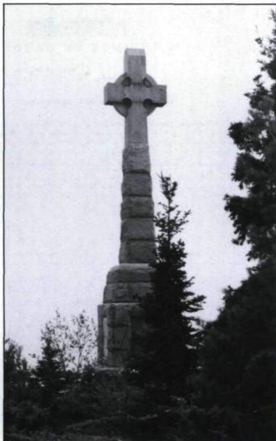
La croix celtique dessinée par Jeremiah Galagher est inaugurée en 1909 par la Ancient Hibernian Society en commémoration de la présence irlandaise dans l'île.

constatent l'état pitoyable de lieux et entreprennent de corriger la situation. Pendant douze ans ils s'ingénient à trouver les moyens d'ériger un monument destiné à commémorer cette étape marquante dans l'histoire de leur ethnie.