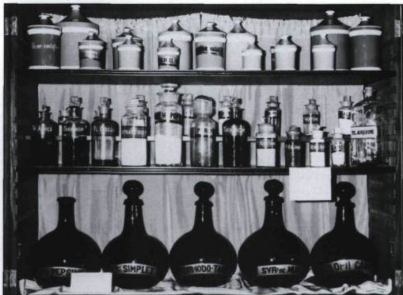
Armoire de pharmacie datant de la fin du XVIII e siècle. Don des jésuites aux Augustines de l'Hôtel-Dieu de Québec en 1800.

Le capillaire, plante médicinale locale, guérit les affections de la poitrine: on en prépare un sirop ou un thé pour guérir les rhumes et les maladies pulmonaires. On attribue au capillaire des propriétés stomachiques. Il sert aussi d'apéritif.