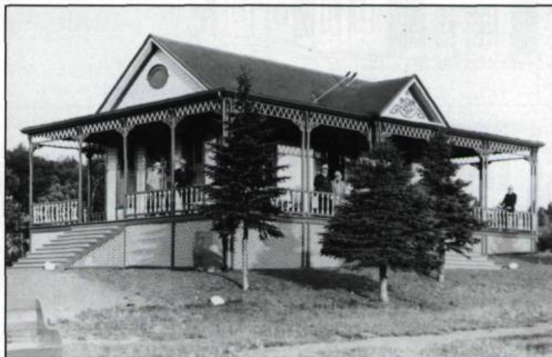
Ouvert en 1868, le club de golf de Sainte-Pétronille est l'un des plus anciens en Amérique. (Archives nationales du Québec).

de golf d'Amérique. Réservé aux villégiateurs anglophones, il possède seulement trois trous à l'origine. Il est établi sur une partie du domaine Dunn, une autre grande propriété typique du Bout de l'île. Plus que centenaire, le club de golf de Sainte-Pétronille n'aurait été devancé que par le club Royal Quebec . Son parcours permettait aux villégiateurs, par ailleurs grands amateurs de tennis et de croquet, de se rencontrer.