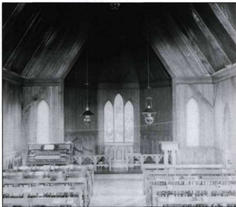
Vue de l'intérieur de l'église anglicane St.Mary's.

cane de St.Mary's, construite en 1867, atteste la présence de plusieurs protestants à Sainte-Pétronille.