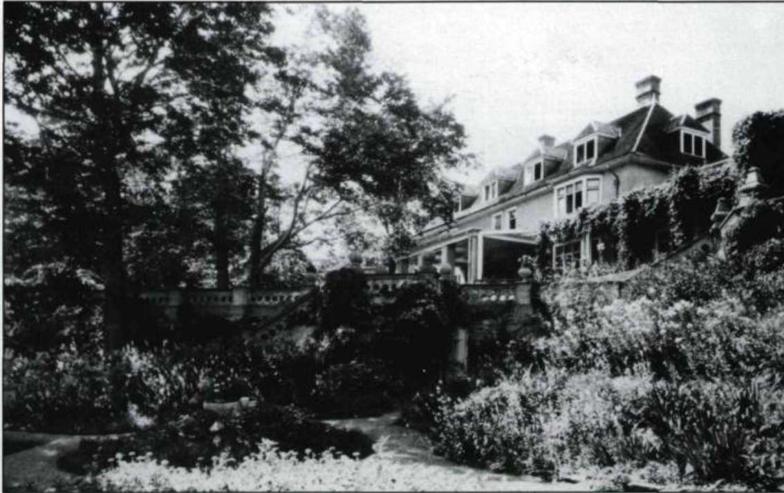
L'entretien des nombreuses plantes exotiques et aborigènes qui décoraient les vastes jardins à l'italienne de la villa Porteous nécessitait le travail de cinq jardiniers.