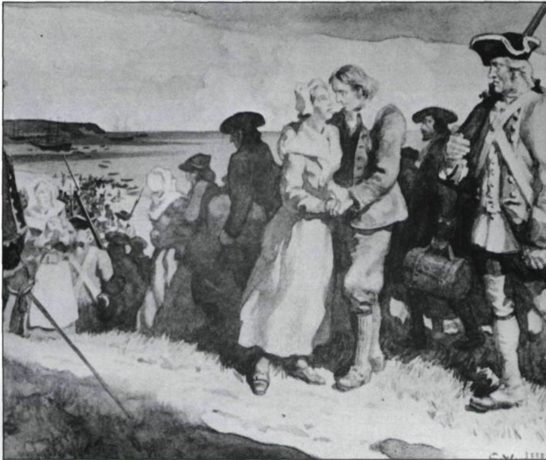
Sur les ordres des autorités anglaises en 1755, quelques milliers d'Acadiens sont déportés de Grand Pré en Nouvelle-Écosse. L'embarquement donne lieu à des scènes déchirantes. (Archives nationales du Canada, C.W. Jefferys).