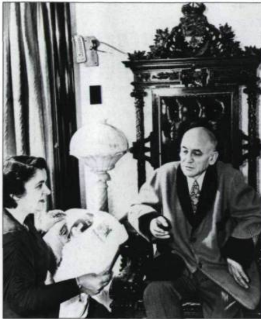
Télesphore-Damien Bouchard (1881-1962). Journaliste et homme politique, il occupe en 1939 les poste de ministre de Travaux publics et de la Voirie et va jouer un rôle stratégique dans la négociation entre Godbout et le cardinal Rodrigue Villeneuve.

Théâtrale à souhait, cette thèse fait de Godbout un faible et du père Lévesque un thaumaturge. De même, en attribuant à de bons conseils la fermeté finale du premier ministre, cette thèse laisse dans l'ombre l'engagement contenu dans le programme électoral de Godbout. L'autre version s'inscrit dans une plus longue durée. Rumilly écrit en effet: «...Madame Casgrain et Idola Saint-Jean mènent la lutte depuis vingt ans. Elles consentent à leur cause un suprême sacrifice en avouant cette ancienneté. Toutes deux sont très douées. Madame Casgrain dispose d'influences politiques, au point qu'on la croit candidate au Sénat. Elle a converti ou contribué à convertir le premier ministre Godbout. Elle le pousse à franchir le dernier obstacle, qui n'est pas le moindre, puisque le cardinal l'a dressé.»