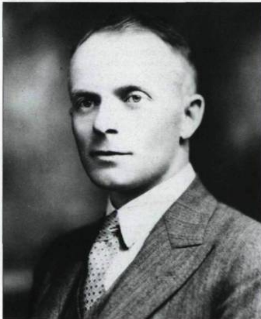
Adélar Godbout (1892-1956), agronome, professeur, et homme politique. Premier ministre de la province de Québec de 1939 à 1944, il présente lui même le «bill» accordant aux femmes le double droit de vote et d'éligibilité.

Adélar Godbout, qui a toujours voté contre le suffrage féminin, présente lui-même, en soutenant que les temps sont changés, le bill accordant aux femmes le double droit de vote et d'éligibilité.