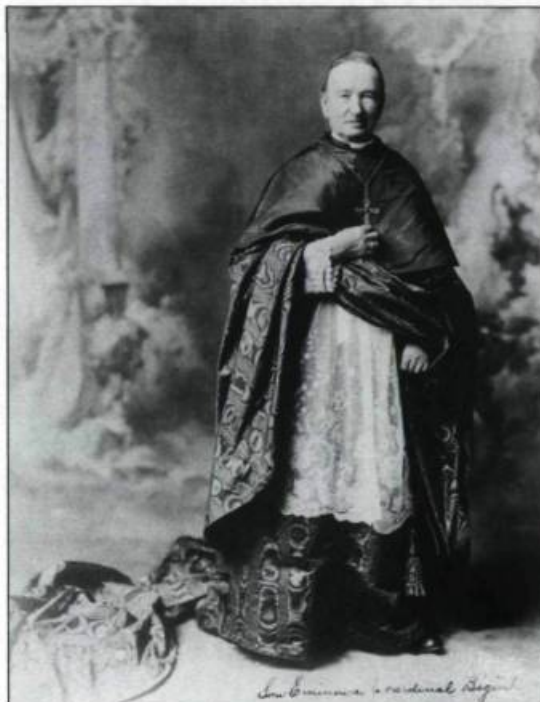
Louis-Nazaire Bégin (1840-1924), créé cardinal en 1914, est l'un des co-fondateurs de l'Action catholique. Dès 1922 il s'oppose au suffrage féminin et affirme que l'ensemble des évêques et les autorités romaines partagent ses idées.

«Le mouvement féministe, dans la province de Québec, remonte à 1912. Mais l'action véritable s'est déclenchée en 1922, après la fondation du Comité provincial pour le suffrage féminin, présidé par Madame Marie Gérin-Lajoie et qui comptait Madame Thérèse Casgrain et Madeleine Idola Saint-Jean parmi ses animatrices.