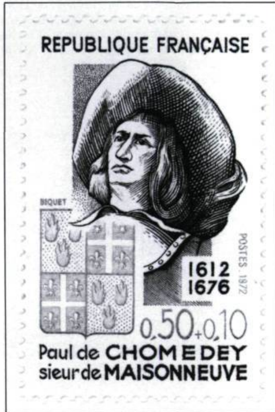
En 1972, la France honorait Paul de Chomedey, sieur de Maisonneuve (1612-1676), fondateur de Montréal.