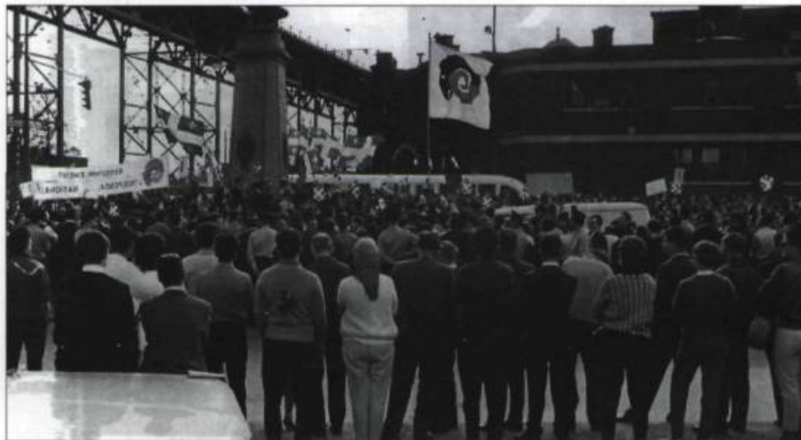
Manifestation du RIN au monument aux Patriotes de 1837. (André D'Allemagne. Le RIN et les débuts du mouvement indépendantiste québécois . Montréal : Éditions l'Étincelle, 1974. (Collection : la Librairie du Faubourg, Québec).

entré au PQ et comme c'étaient des militants, ils prenaient beaucoup de place. Dans un congrès du PQ, il y avait 40 % de délégués venus du RIN. Lévesque voulait nous tuer. Il a fait des misères aux gens du RIN entrés au PQ. Il refusait de se faire photographier avec moi, même avec les gens du RIN. Il y a eu de grosses querelles. En 1970, c'était l'élection. Moi, je voulais retourner à Sept-Îles, mais Lévesque a dit : «Jamais!», et il m'a fermé tous les bons comtés. J'ai décidé d'aller dans Mer-