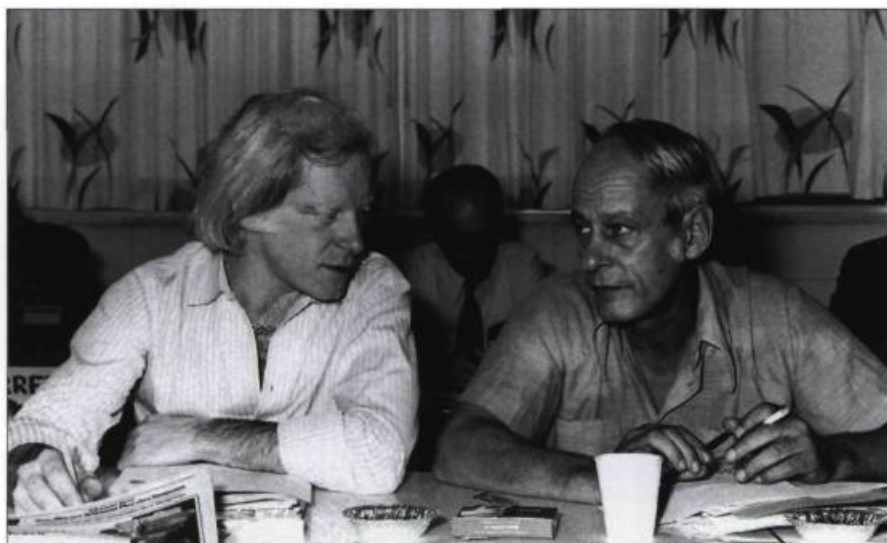
René Lévesque et Pierre Bourgault à la réunion du Conseil national du Parti québécois à Chicoutimi, le 11 septembre 1971.

P.B. : Oui, on en faisait beaucoup, de même que des manifestations. Lévesque