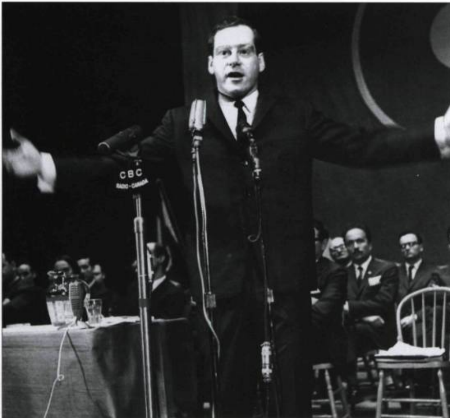
Pierre Bourgault, président du RIN, prononçant un discours en 1968.

rée». Elle a toujours gardé sa majorité par la suite. On a pris une majorité à Shefferville, mais on s'est fait balayer sur la Basse-Côte-Nord. J'ai perdu par 2 % des voix, ça a été très proche. Il y avait deux partis indépendantistes en même temps, le RIN et le RN. Ensemble, on a pris 9,3 % des votes.