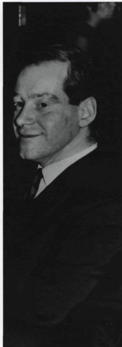
Pierre Bourgault, président du RIN en 1966.

peu sur le plan personnel! Les maîtres à penser ont été étrangers finalement, parce que, à partir de ce moment-là, c'était de la décolonisation. C'était surtout l'Algérie, c'était Albert Memmi et Frantz Fanon. C'est là que j'ai pris mes grands principes. Je n'ai jamais lu Groulx de ma vie, je trouvais ça ennuyeux, au