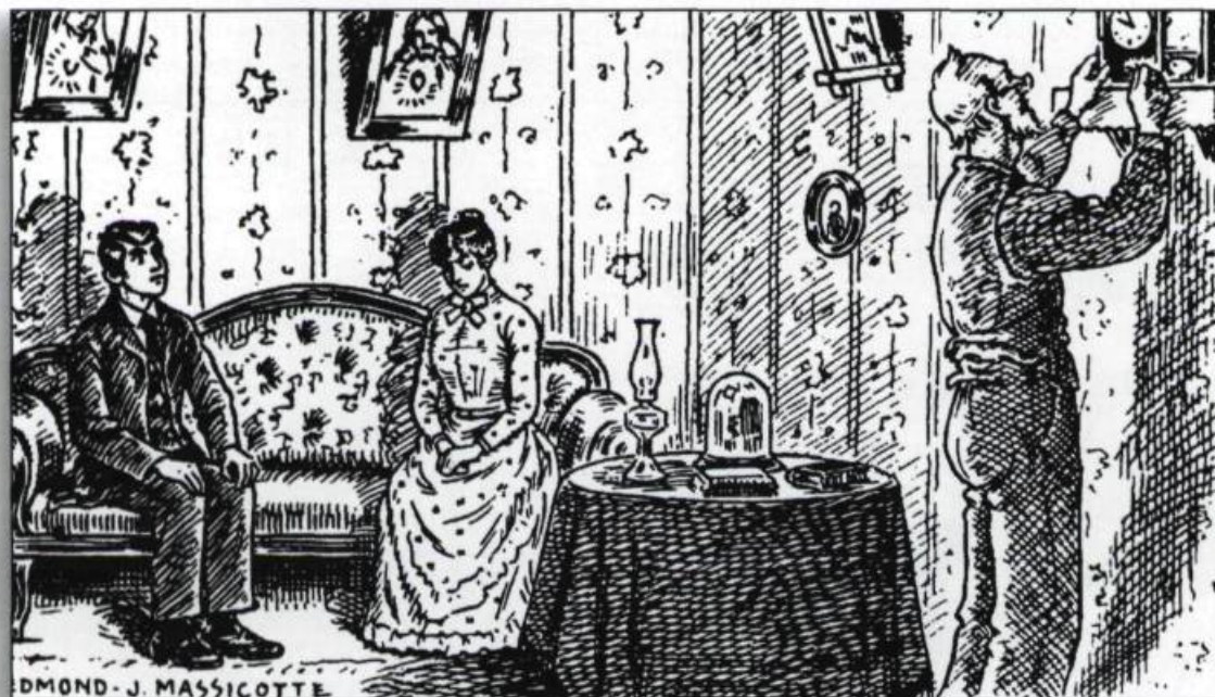
«Les fréquentations d'autrefois». Quand les parents sont d'accord avec le choix de leur fille, les visites se poursuivent, mais sous haute surveillance. Illustration d'Edmond-J. Massicotte, Almanach du peuple , 1928.

Ces activités et ces modes d'encadrement des jeunes, typiques des milieux ruraux, se remarquent aussi à la ville, le regroupement de familles apparentées dans le même quartier, sinon dans la même rue, facilitant le maintien des traditions. Le cinéma, qui connaît une vogue extraordinaire dès son apparition, les salles de danse,