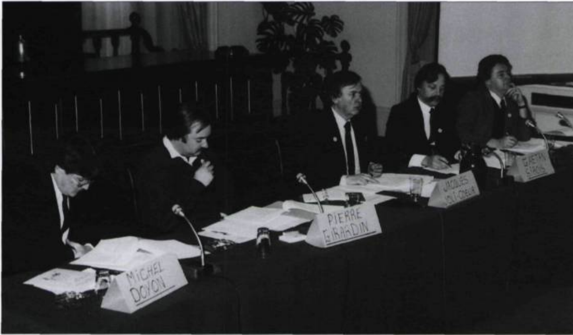
Assemblée annuelle de la Caisse tenue dans la salle du Conseil à l'hôtel de ville de Québec.