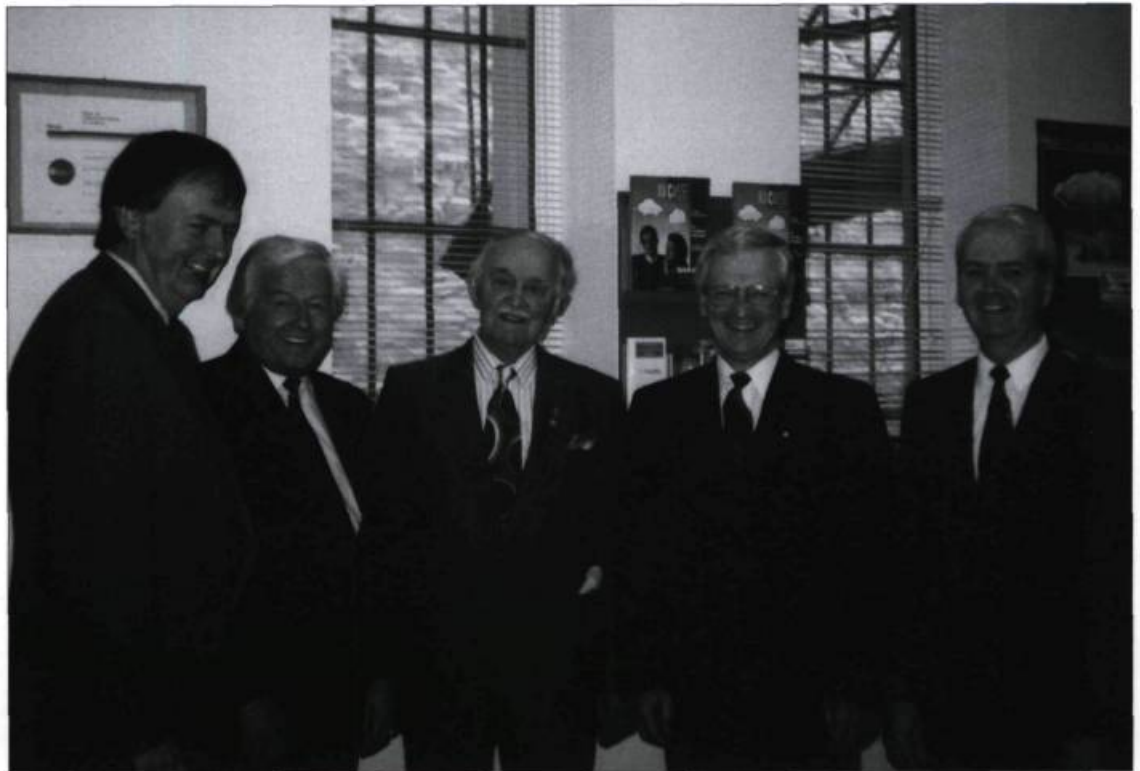
Visite de Claude Béland à la Caisse, en 1993.

J'aimerais aussi souligner que la Caisse populaire du Vieux-Québec a coopéré avec les autres caisses de la haute-ville, puis avec celles de la