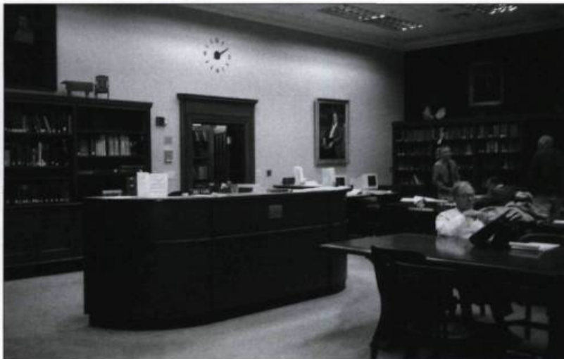
Salle de consultation de la New England Historical and Genealogical Society de Boston. Photographie Sylvie Tremblay, 1998. (Archives de l'auteur).

En septembre 1973, une première rencontre a lieu au collège Saint-Anselme de Manchester, New Hampshire, où près de 40 personnes sont présentes. Vingt-cinq ans plus tard, cette société compte plus de 2 900 membres actifs. Au cours des dernières années, elle a procédé à l'acquisition du presbytère de la paroisse Blessed Sacrament Church de Manchester où a été relouée la bibliothèque. On y retrouve les grands titres de la généalogie québécoise, mais aussi de nombreux ouvrages portant sur les États de la Nouvelle-Angleterre, en particulier le New Hampshire et le Maine. Pour un coût minime, les utilisateurs peuvent avoir accès à la banque Parchemin pour les actes notariés rédigés en Nouvelle-France entre 1635 et 1765. Cette société est très active dans la publication de répertoires de baptêmes, de mariages et de décès. Dernièrement, son champ d'action s'est étendu à l'État de New York, particulièrement la région d'Albany. Adresse : P.O. Box 6478, Manchester, NH 03108-6478 http://www.acgs.org