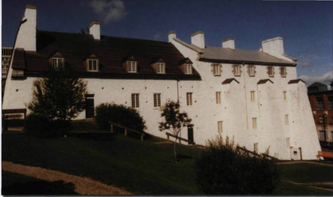
Après la redoute du cap Diamant à la Citadelle, érigée en 1693, la redoute Dauphine, qui a été achevée en 1749, est le plus ancien bâtiment militaire de Québec.

Bonnet, offre deux espaces : la salle Louis-Frédérique, plus vaste, accueille grandes productions et vedettes internationales de tout acabit; la salle Octave-Crémazie est la scène du Théâtre du Trident, une compagnie qui offre au public de la capitale des pièces du répertoire et des créations depuis 1971. Pas loin de là, le Périscope s'est refait une toilette : sait-on encore que ce fut une synagogue? Le Théâtre Blanc, le Théâtre Petit à Petit, le Théâtre Niveau Parking y présentent des créations qui s'exportent ou travaillent en synergie avec des troupes d'autres pays francophones. Le Théâtre de la Bordée vient tout juste d'inaugurer sa nouvelle salle permanente dans le quartier Saint-Roch. La Maison de la chanson accueille les chanteurs à textes. Gilles Vigneault et Sylvain Lelièvre avaient commencé leur carrière dans de modestes boîtes à chansons, Sophie Anctil et les Batinses montent maintenant à l'assaut de publics plus nombreux et plus exigeants. D'autres salles, dans des quartiers un peu plus excentriques, sans oublier les théâtres d'été, sont autant de lieux fréquentés par tous. Quant à Robert Lepage, dont le monde entier apprécie l'originalité et les créations époustouflantes ( Vinci, Les Aiguilles et l'Opium, La Face cachée de la Lune ), il a eu le flair d'installer son groupe de théâtre expérimental dans une ancienne caserne de pompiers.