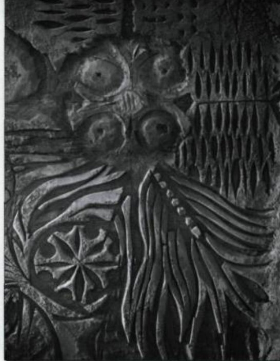
Murale de Jordi Bonnet ornant les murs du Grand Théâtre de Québec, détail.

Une capitale a par définition les yeux ouverts sur le monde : deux consulats généraux d'envergure (France, États-Unis), un milieu universitaire de longue tradition (l'Université Laval a fêté les 150 ans de sa charte royale et les 340 ans de sa fondation en 2002) et innovateur (la Téléuq de l'Université du Québec), des formations en métiers d'art peu communs (joaillerie, reliure d'art, verrerie d'art), une pléiade d'associations en tous genres témoignent du dynamisme d'une capitale moins densément peuplée que Montréal, la métropole, mais tout aussi fourmillante d'activités diverses. La Ville de Québec a créé un Conseil de la culture, instance de citoyens et de professionnels, qui veille au respect des traditions. Il donne un coup de pouce financier à certaines des idées les plus sages ou les plus folles, qui ne pourraient se réaliser sans cette aide indispensable. Un Festival international du film, le Carnaval de Québec, le Carrefour international de théâtre, le Festival d'été, les Fêtes de la Nouvelle-France, d'innombrables colloques, plutôt savants, et congrès, plus achalandés, se succèdent tout au long de l'année dans une capitale dont