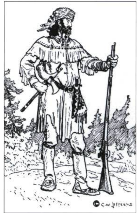
Ce dessin et cette légende de Charles William Jefferys a pour seul mérite de réunir tous les clichés entourant le costume des coureurs des bois. Cette illustration est publiée pour la première fois en 1942 dans le livre à succès The Picture Gallery of Canadian History . Cette image, comme bien d'autres, a forgé une vision faussement exotique de l'habillement des coureurs des bois qui s'imposera dans les mémoires. ( The Ryerson Press ).

La fonction première du coureur des bois est de mener au printemps un canot d'écorce chargé de marchandises dans les contrées éloignées et de le ramener avec un maximum de fourrures avant que les rivières ne gèlent à nouveau. Durant ces voyages épuisants, ces hommes tentent d'éviter les portages qui les forcent à transporter sur leurs épaules bagages et embarcations. Continuellement, les payeurs se jettent à l'eau pour tenter d'alléger leurs canots et franchir un rapide à l'aide de perches et de sangles afin d'éviter cette