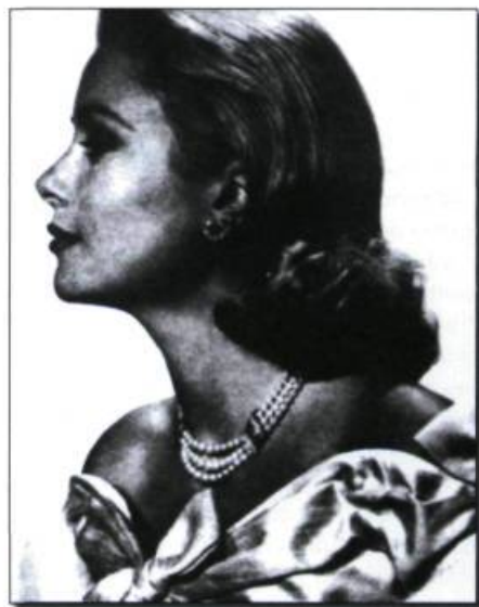
Grace Kelly parée du collier et des boucles d'oreilles en perles et diamants offerts par le prince Rainier en cadeau de mariage (Van Cleef & Arpels).

Après la Seconde Guerre mondiale, une redistribution de la richesse s'opère, on assiste alors à un mélange des classes sociales. Les hommes rentrent au pays, on célèbre de nombreux mariages; c'est le début d'un phénomène appelé baby-boom. Une ombre au tableau toutefois : dès la fin de la décennie, l'Amérique apprend que les Russes possèdent la bombe atomique... Il reste que la vie devient en général plus confortable : téléviseur, machine à laver le linge, réfrigérateur, etc.