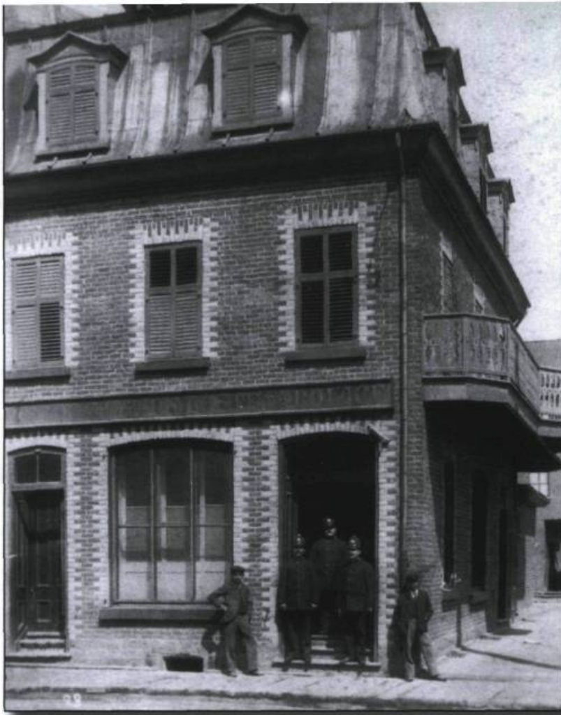
■ Poste de police de la rue Hermine, vers 1897.

Ces incidents font l'objet de plaintes de la part des policiers, qui cherchent à dénoncer des assauts et des actes d'opposition dont ils auraient été victimes. Dans certains cas, il s'agit d'insultes ou de critiques dirigées contre des constables. Elles peuvent mettre en doute la pertinence d'une arrestation, ou encore ridiculiser la crédibilité des policiers comme représentants de la loi en raison d'un manque de discernement, de courage ou de virilité. Citons, par exemple, la plainte du constable irlandais Mile M. Burke, qui accuse, en novembre 1870, le commis James Sewill de lui avoir dit « [that] he would not take up a man, but only boys [...] » à la suite de l'arrestation d'un enfant qui lançait des balles de neige. Dans d'autres cas, l'opposition populaire se manifeste par des gestes beaucoup plus violents, comme dans la plainte déposée contre Michael Delaney, en mai 1880. Ce dernier aurait été traduit devant le recorder pour avoir mordu un constable et frappé son collègue « [...] in the privates [...] » lors de son arrestation au marché Champlain. Dans d'autres situations, plus rares, les policiers sont littéralement assaillis par plusieurs individus, souvent des marins ou des soldats, qui cherchent à empêcher l'arrestation d'un des leurs.