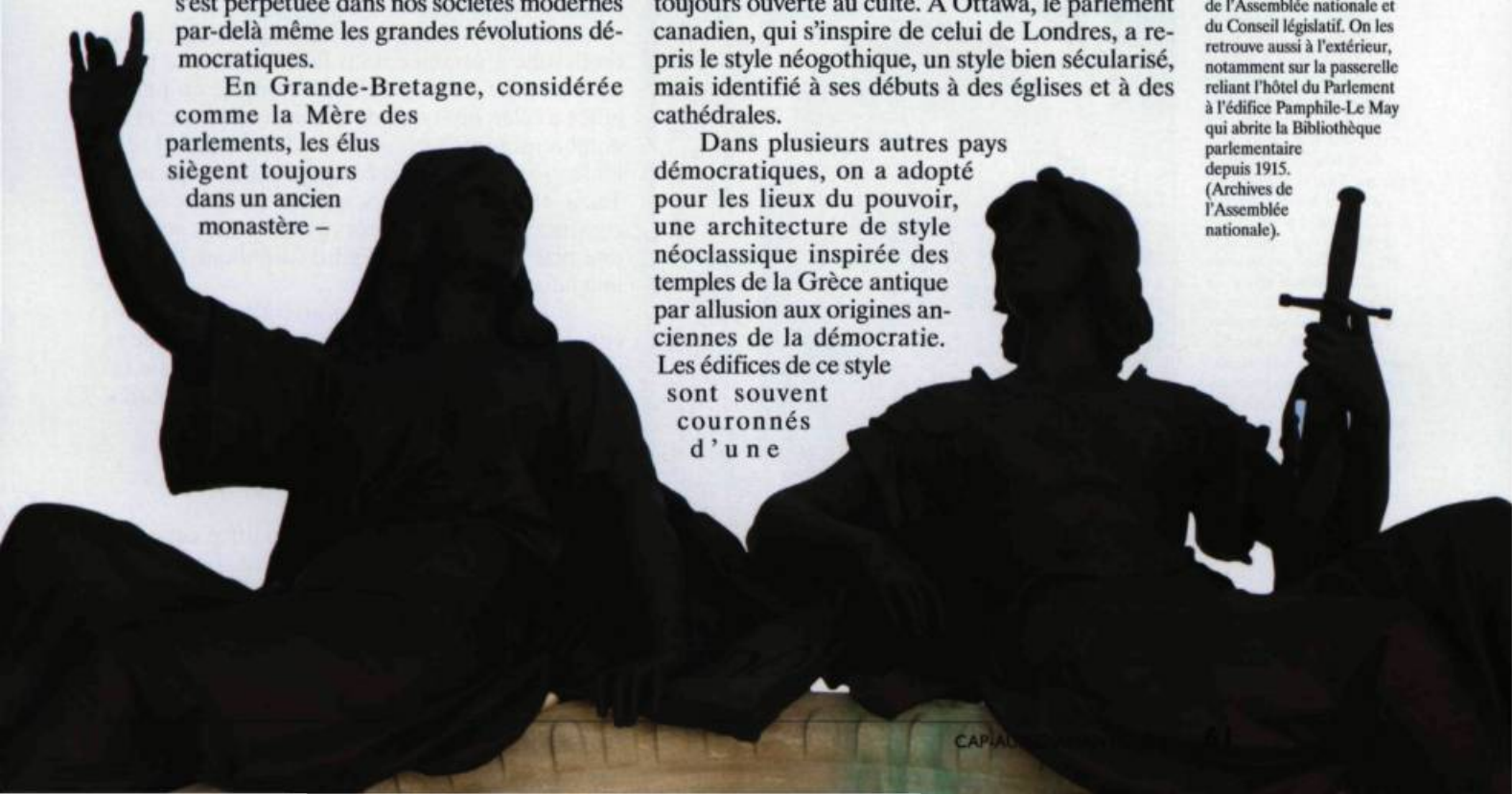
Les anges, autres figures célestes jouant un rôle d'intermédiaire entre Dieu et les hommes, sont plusieurs fois représentés dans les salles de l'Assemblée nationale et du Conseil législatif. On les retrouve aussi à l'extérieur, notamment sur la passerelle reliant l'hôtel du Parlement à l'édifice Pamphile-Le May qui abrite la Bibliothèque parlementaire depuis 1915.

Dans plusieurs autres pays démocratiques, on a adopté pour les lieux du pouvoir, une architecture de style néoclassique inspirée des temples de la Grèce antique par allusion aux origines anciennes de la démocratie. Les édifices de ce style sont souvent couronnés d'une