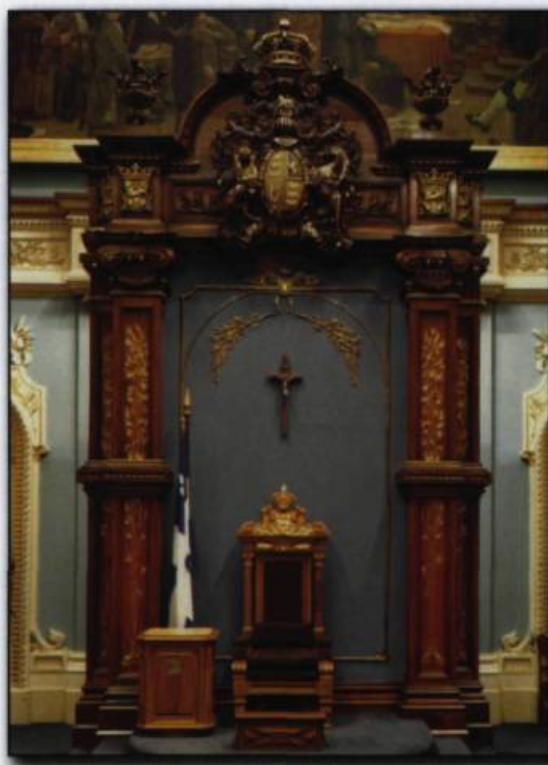
La devise « Dieu et mon droit » au-dessus du trône.

En Grande-Bretagne, considérée comme la Mère des parlements, les élus siègent toujours dans un ancien monastère –