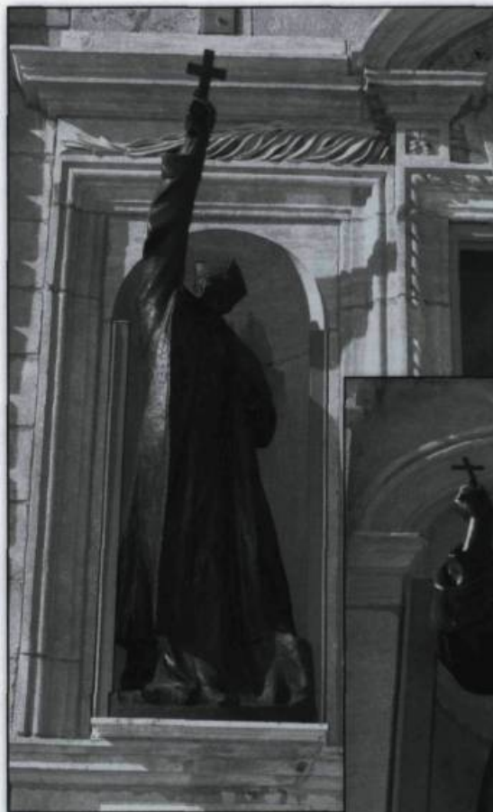
Les statues de Jean de Brébeuf, de M re François de Laval et de Marguerite Bourgeoys.

Les anges, autres figures célestes jouant un rôle d'intermédiaire entre Dieu et les hommes, sont plusieurs fois représentés dans les salles de l'Assemblée nationale et du Conseil législatif. On les retrouve aussi à l'extérieur, notamment sur la passerelle reliant l'hôtel du Parlement à l'édifice