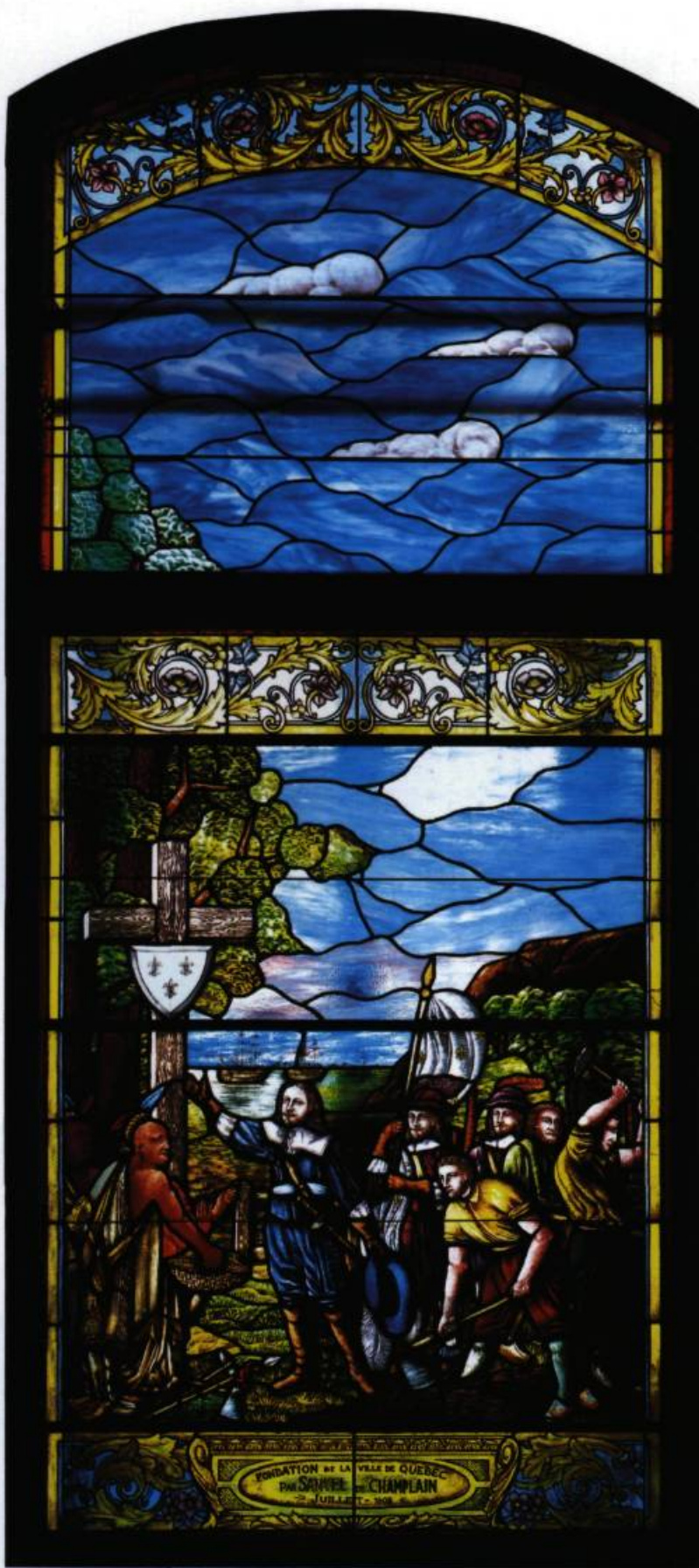
Champlain devant la croix à Québec (vitrail). (Archives de l'Assemblée nationale).

il porte aussi une signification religieuse, associée au choix et à la volonté divine. Le chêne représente la force et la durée, le laurier, la gloire et l'immortalité. Quant au papyrus qui orne les panneaux de bois des vestibules et des salles parlementaires, il est associé à l'écriture, au livre et à la pérennité du savoir et de la connaissance.