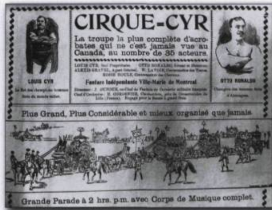
Affiche du Cirque Cyr. (Collection privée).

Toutefois, les chroniqueurs de l'époque ont la fâcheuse habitude de ne pas produire de critiques sur nos artistes. À de nombreuses reprises, les journalistes négligent même de les présenter adéquatement. « Ils sont trop avantageusement connus du public pour qu'il soit utile d'en faire un long éloge », prétextent-ils. Parfois encore, les artistes sont annoncés comme d'origine française ou européenne.