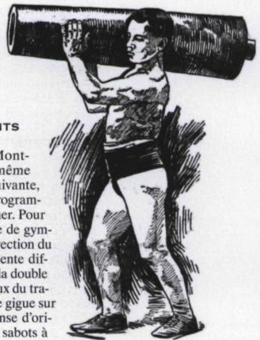
« Nos hommes forts », Arthur Bourret. ( La Patrie , le samedi 1 er mai 1909, p. 3).

Le Parc d'amusement Mont-Royal, situé dans la rue du même nom, ouvre en 1891; l'année suivante, il deviendra le parc Royal. Sa programmation imite celle du parc Sohmer. Pour son inauguration, la Compagnie de gymnastique Mont-Royal, sous la direction du professeur J.-B. Perrault, y présente différents numéros de variétés : de la double barre horizontale au saut périlleux du trapèze simple, du sand jig (sorte de gigue sur sable) au double clog dance (danse d'origine anglaise exécutée avec des sabots à