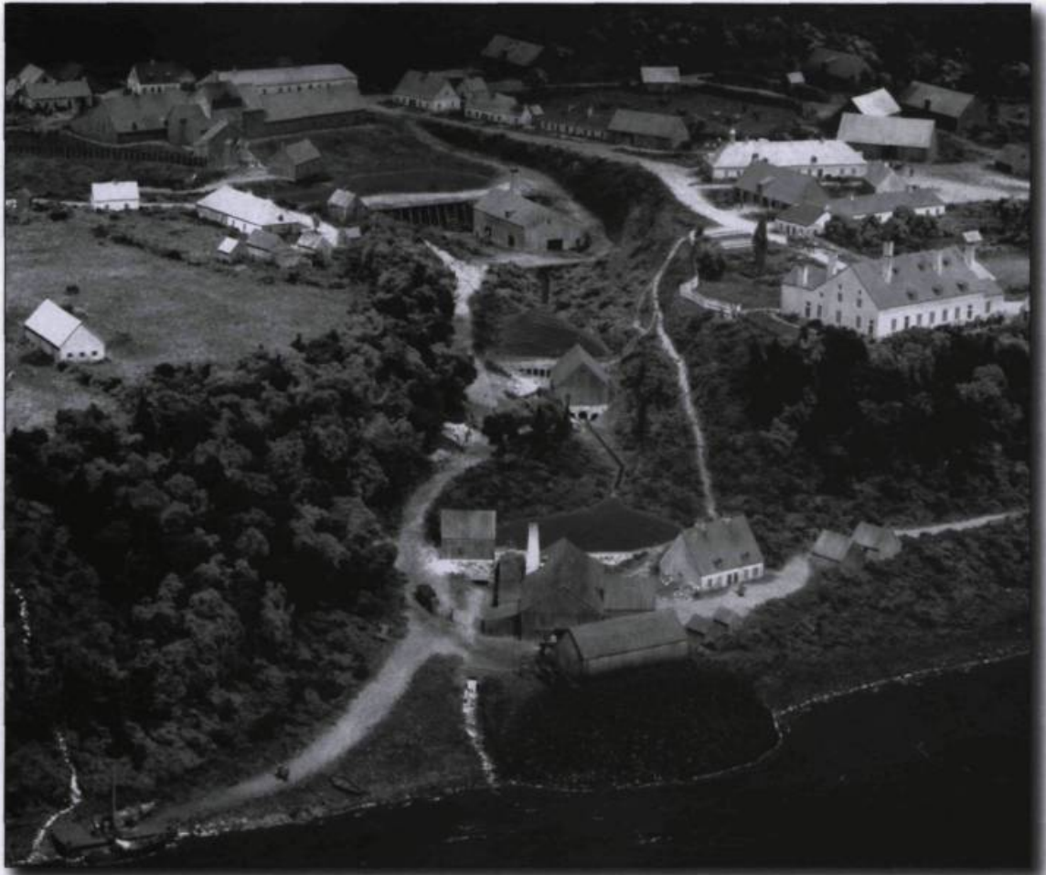
La maquette des Forges du Saint-Maurice exposée à la grande maison et représentant l'établissement au milieu du siècle dernier. Photo : Jacques Beardsell, 1990. (Parcs Canada, 130/IN/PR7/SPO-00065).

Tout un quartier du secteur des « vieilles forges » arbore fièrement une toponymie liée à l'histoire des Forges du Saint-Maurice. Des noms d'anciens directeurs et de familles ouvrières influentes, en plus de certains métiers d'importance ont servi à nommer quelques rues du secteur. Lors de la fusion des municipalités qui forment aujourd'hui la grande ville de Trois-Rivières, l'occasion fut belle de changer les dénominations communes en puisant dans le riche répertoire que pouvait fournir l'histoire des Forges. C'est ainsi qu'une dizaine de rues supplémentaires incarnent à leur tour l'histoire de cette première industrie sidérurgique au pays.