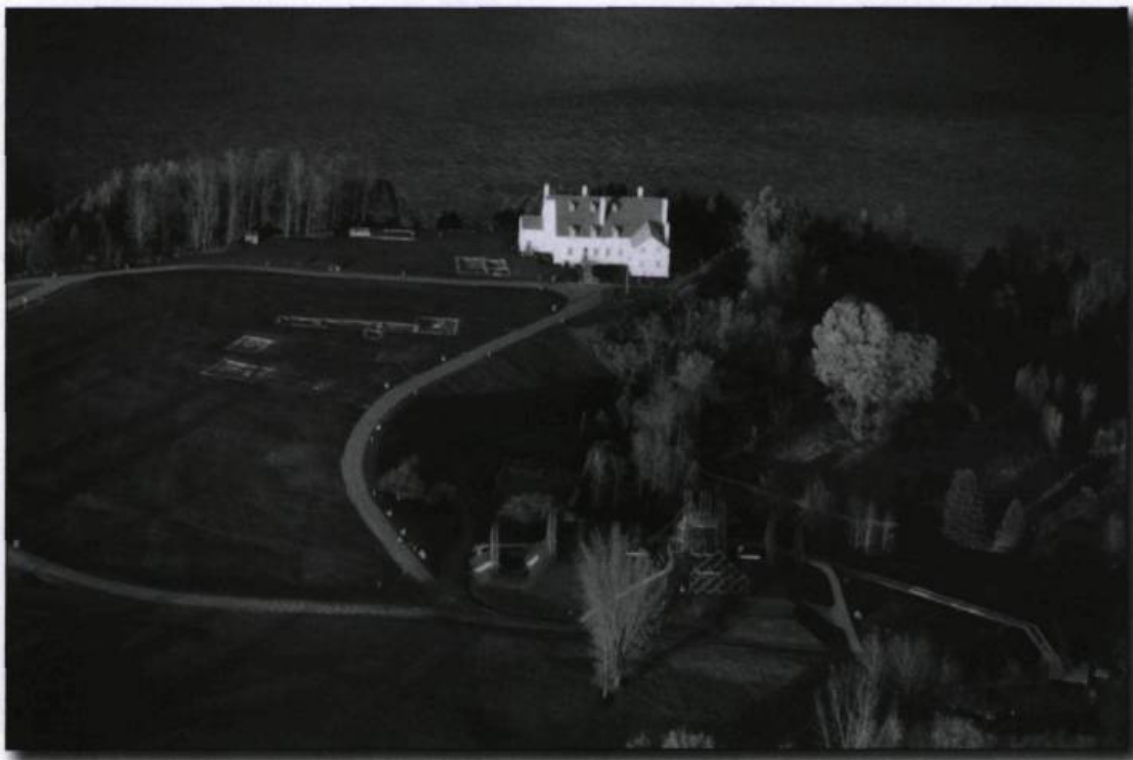
Le site des Forges du Saint-Maurice vers 1870, vu de la grande côte, tel qu'il se présentait aux visiteurs venant de Trois-Rivières. Photo : John Henderson, vers 1870. (Archives nationales du Canada, PA-135-001).

La réorientation de l'entreprise nécessita l'embauche d'ouvriers spécialisés qui devaient vivre à proximité de leur lieu de travail. C'est finalement une véritable petite communauté qui s'établira aux Forges. Elle atteindra même jusqu'à 425 personnes en 1842. Un noyau important de résidants se trouvait donc au nord de la cité de Lavolette bien que ceux-ci soient isolés géographiquement du reste de la population trifluvienne. Les occasions étaient toutefois nombreuses pour les habitants des Forges d'aller aux Trois-Rivières. Même si on trouvait à peu près tout ce dont on avait besoin sur les lieux même de l'entreprise, on