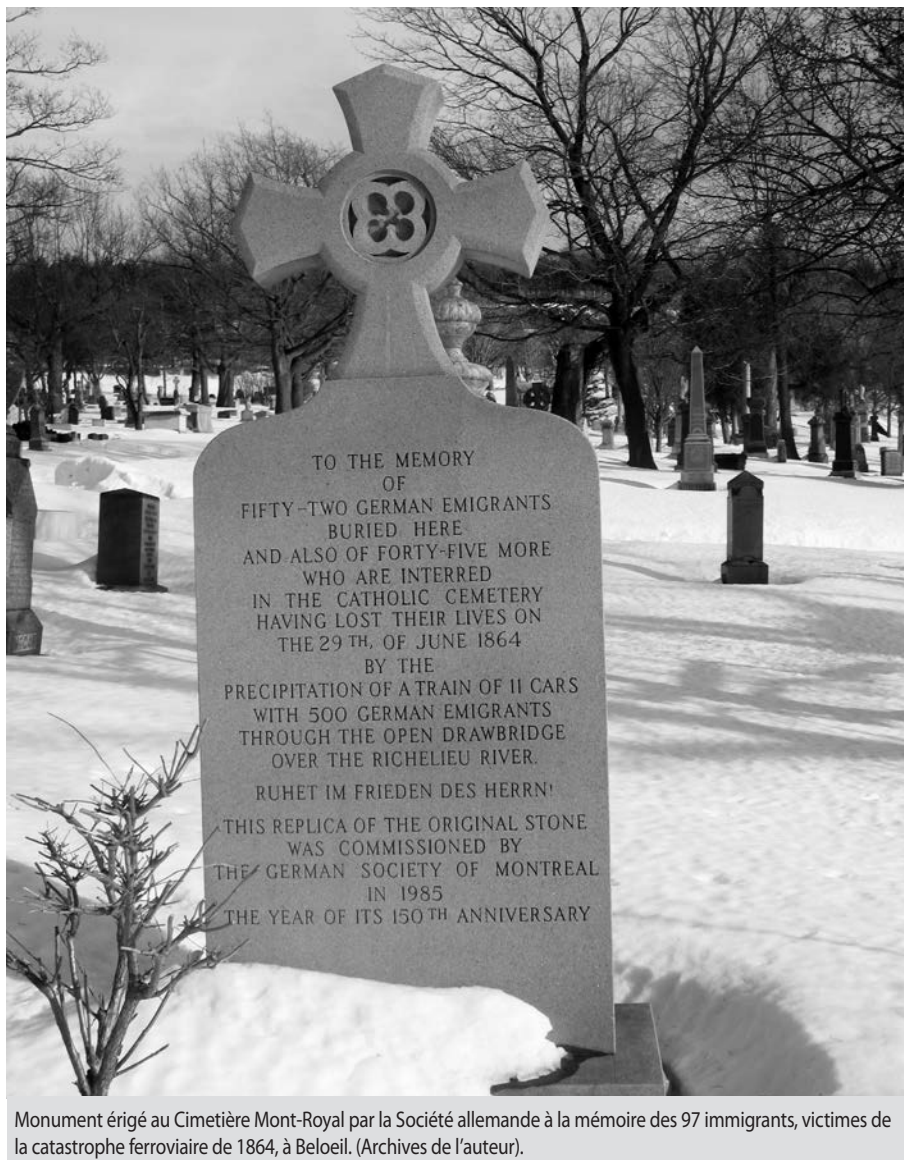
Monument érigé au Cimetière Mont-Royal par la Société allemande à la mémoire des 97 immigrants, victimes de la catastrophe ferroviaire de 1864, à Beloeil.

Rappelons que, depuis longtemps, les Allemands sont venus s'établir au Québec et ont fait souche au pays. Depuis l'arrivée, en 1664, de Hans Bernhardt de la ville d'Erfurt qui acheta deux arpents de terre à l'est de Québec face à l'île d'Orléans, il y a toujours eu une source, et parfois même des vagues importantes d'immigration de germanophones en provenance de plusieurs pays. Règle générale, ils se sont bien intégrés, adoptant souvent les mœurs et les coutumes de leur pays d'accueil. Dans la mesure où plusieurs de ces Allemands ont adapté leur nom et ont pris la langue, la religion et les traditions de la majorité francophone, il est devenu facile d'oublier leurs origines. Leur contribution à l'évolution et à l'épanouissement de la société québécoise est cependant significative. Étant donné que la majorité de nos immigrants « allemands » pendant trois siècles, jusqu'en 1950,