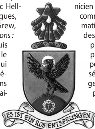
Armoiries de l'église luthérienne Saint-Jean, Montréal.