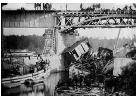
Accident ferroviaire de Saint-Hilaire-Beloeil du 29 juin 1864.

l'examen de la vie associative de notre communauté allemande.