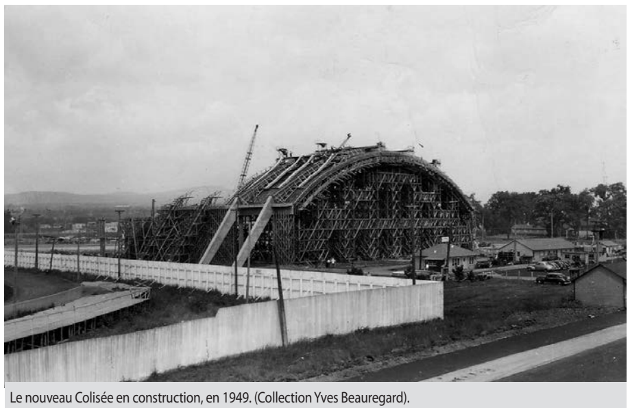
Le nouveau Colisée en construction, en 1949. (Collection Yves Beaugard).

crit au registre des propriétés historiques de la Colombie-Britannique. Le Halifax Forum en briques rouges, édifié en 1926, et l'aréna W.C. O'Neill, bâtiment d'architecture moderne, construit en 1962, sont protégés en Nouvelle-Écosse et au Nouveau-Brunswick. Enfin, le Forum de Montréal (1926) et le Maple Leaf Garden de Toronto (1931) sont devenus des lieux historiques nationaux en 1997 et 2007,