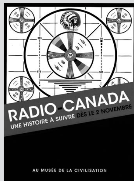
Radio-Canada, une histoire à suivre. Musée de la civilisation de Québec.

http://www.mcq.org/fr/mcq/expositions.php