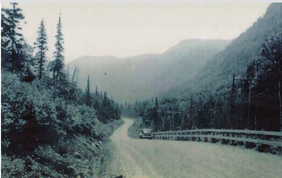
La route 54 dans le parc des Laurentides.

Derrière cette modernisation du réseau routier québécois, une nouvelle réalité apparaît : l'État québécois décide d'encourager les touristes américains et canadiens-anglais à visiter le Québec. Avec la démocratisation de l'automobile, le tourisme itinérant connaît une croissance exponentielle : autour de 32 000 automobiles de touristes franchissent les frontières du Québec en 1920 pour atteindre près de 200 000 en 1924, un nombre qui grimpe à 625 000 en 1929. Le géographe Raoul Blanchard a d'ailleurs bien cerné les causes de ce phénomène. Dans sa grande synthèse sur le Canada français, il écrit que les visiteurs viennent voir au Québec les témoignages d'une histoire plusieurs fois séculaires. À travers la visite des vieilles maisons et des vieilles églises, c'est un