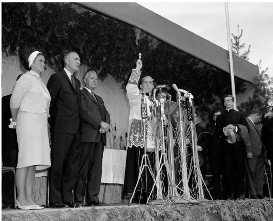
Autrefois, l'inauguration et la bénédiction allaient de pair, comme en fait foi cette photo prise lors de l'ouverture du pont de l'Île-aux-Tourtes, liant Vaudreuil-Dorion à Senneville, à l'extrémité est de l'autoroute Félix-Leclerc. Nous reconnaissons à gauche la ministre des Transports et des Communications, Claire Kirkland-Casgrain, le ministre de la Voirie, Bernard Pinard, et le premier ministre, Jean Lesage. (Inauguration du pont de l'Île-aux-Tourtes, Claude Gosselin. 1965. Bibliothèque et Archives nationales du Québec).

Pour identifier une autoroute, le ministère des Transports lui attribue un numéro selon la classification du réseau routier au Québec. Les adjectifs numériques constituent la seule désignation officielle pour une dizaine d'autoroutes du Québec. Ces dénominations par numéro sont des noms officiels, demeurent très pratiques dans la communication, et