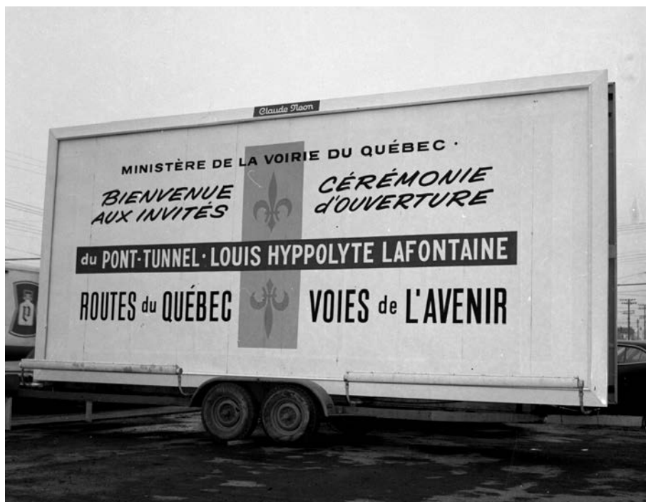
Cérémonie d'ouverture du pont-tunnel Louis-Hippolyte-La Fontaine. Adrien Hubert, 1967. (Bibliothèque et Archives nationales du Québec. E6S7SS1D670571).

La région de Montréal, pour sa part, compte aussi d'importantes infrastructures dont la désignation rappelle le souvenir de personnages historiques. L'autoroute Ville-Marie porte le numéro 720 et s'étend sur près de 9 km, de l'échangeur Turcot jusqu'à la hauteur du pont Jacques-Cartier. Sa désignation