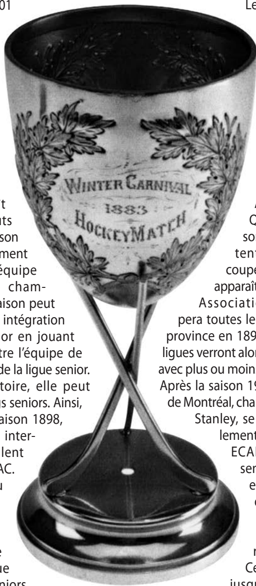
Coupe du Carnaval de Montréal, 1883. (Musée McCord).

Quelques joueurs des Victorias et de la MAAA, regroupés au sein des Wanderers de Montréal, décident en 1904 d'organiser une nouvelle équipe et une nouvelle ligue qui deviendra ainsi une rivale de la « vieille ligue ». La Ligue fédérale amateur de hockey ou FAHL permettra à une première équipe francophone, le National, de jouer dans les rangs seniors. Il existait une rivalité entre cette dernière et le Montagnard pour l'acquisition des meilleurs joueurs fran-