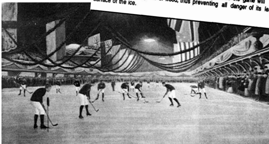
Texte : ( The Gazette , 3 mars 1875, p. 3). Victoria Skating Ring. Carte postale vers 1910. (Collection privée).

Victoria Rink - A game of Hockey will be played at the Victoria Skating Rink this evening between two nines chosen from among the members. Good fun may be expected, as some of the players are reputed to be exceedingly expert at the game. Some fears have been expressed on the part of intending spectators that accidents were likely to occur through the ball flying about in too lively manner, to the imminent danger of lookers on, but we understand that the game will be played with a flat circular piece of wood, thus preventing all danger of its leaving the surface of the ice.