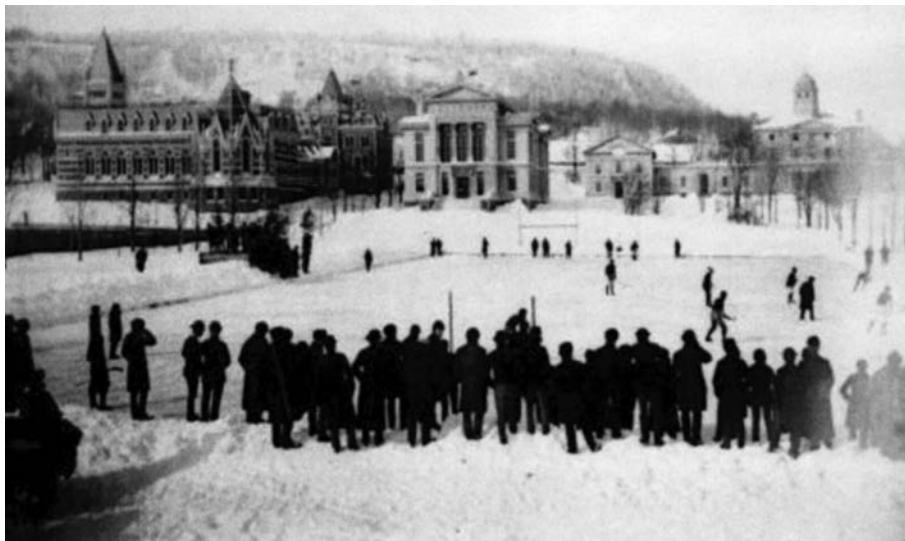
Partie de hockey, durant le Carnaval de Montréal de 1884, sur les terrains de l'Université McGill. (Temple de la renommée du hockey).

l'Université McGill et une équipe de Québec. Comme l'équipe de la Vieille Capitale n'avait que sept joueurs, les deux autres formations durent retirer deux joueurs de la patinoire aménagée sur le fleuve Saint-Laurent à la hauteur du port de Montréal. McGill sera la première équipe championne du hockey moderne.