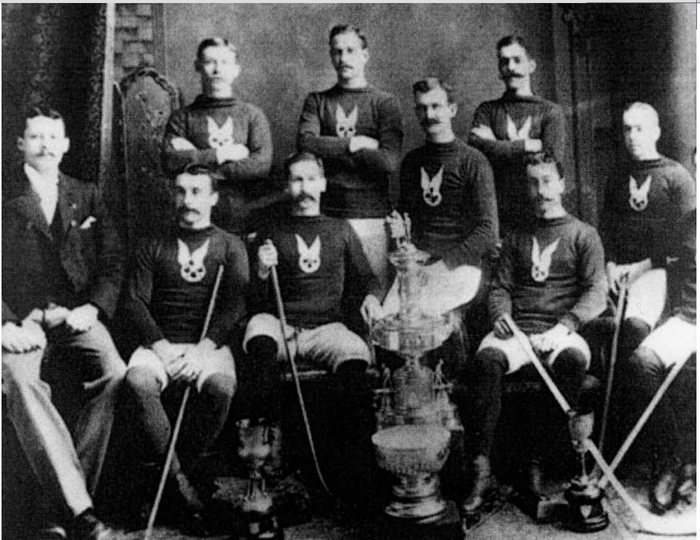
Montreal Athletic Association, premier champion de la coupe Stanley de 1893.