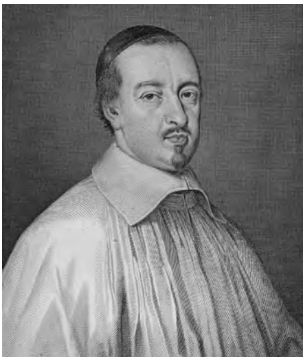
Jean-Jacques Olier (1608-1657), l'un des fondateurs de la Société de Notre-Dame. Il joua un rôle important au sein de l'association et en fut le directeur de 1650 à 1657. Tiré de Lettres de M. Olier, fondateur du Séminaire de Saint-Sulpice , tome 1, Paris, Librairie Victor Lecoffre, 1885.

Les fondateurs de la Société de Notre-Dame sont portés par une nostalgie des origines du christianisme. Désillusionnés par le monde qui les entoure, ces dévots