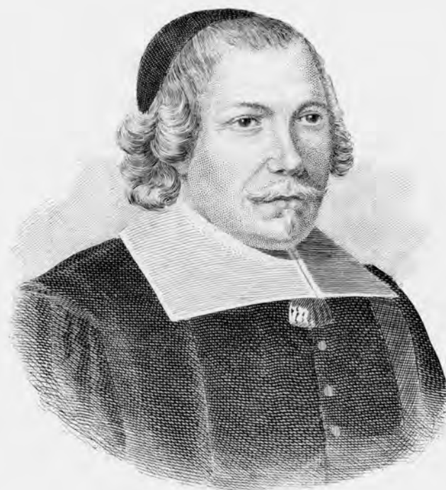
JÉRÔME LE ROYER DE LA DAUVERSIÈRE.

Instituteur des sœurs Hospitalières de La Flèche.