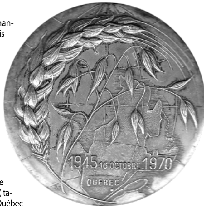
Avers de la médaille de la FAO. (Coll. de l'auteur).

Aujourd'hui, la FAO compte 197 membres. Sa devise est Fiat panis (qu'il y ait du pain pour tous). Elle a pour mission de contribuer à éradiquer la faim, l'insécurité alimentaire et la malnutrition, à éliminer la pauvreté, à favoriser le progrès social et économique pour tous, à gérer et à utiliser de manière durable les ressources naturelles, y compris la terre, l'eau, le climat et les ressources génétiques au profit des générations présentes et futures. En novembre 1979, les pays membres de la