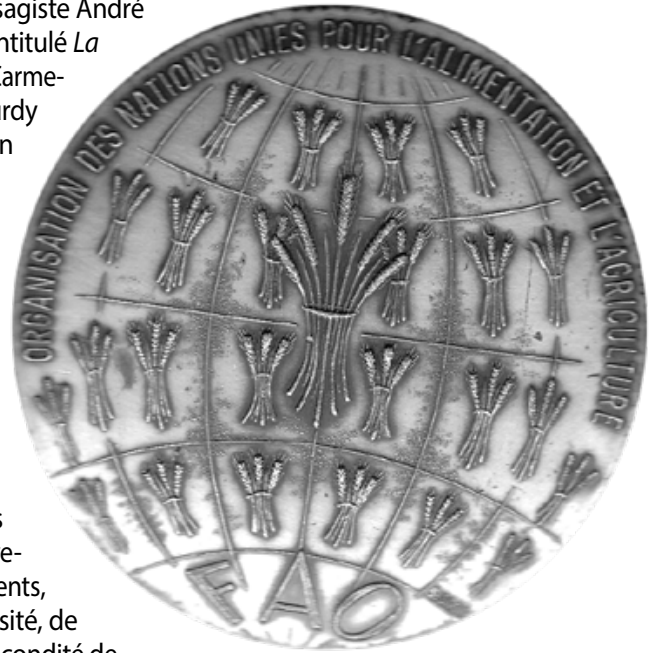
Revers de la médaille de la FAO.