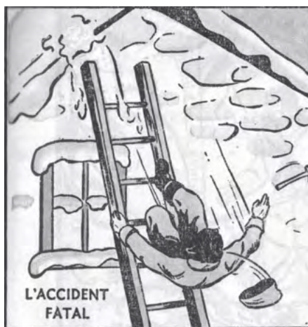
Guy Lavolette. Mon second album d'histoire du Canada . La Prairie, Procure des Frères de l'instruction chrétienne, 1952, p. 27.

Un autre contemporain de Louis Hébert a laissé un récit de son décès. Le récollet Gabriel Sagard est envoyé en mission auprès des Wendats de la baie Georgienne, en 1623. De retour à Paris l'année suivante, le frère Sagard va rédiger une Histoire du Canada en quatre tomes qui est publiée en 1636. Plus précisément, le chapitre XXXVI du second volume de cet ouvrage porte le titre suivant : « D'une petite fille Canadienne baptisée. De sa mort, & de celle du sieur Hebert premier habitant du Canada ». Ce texte raconte que la fille de l'Amérindien Kakemistic est baptisée peu après sa naissance, mais avant son décès. Ce rituel lui donne droit à la sépulture ecclé-