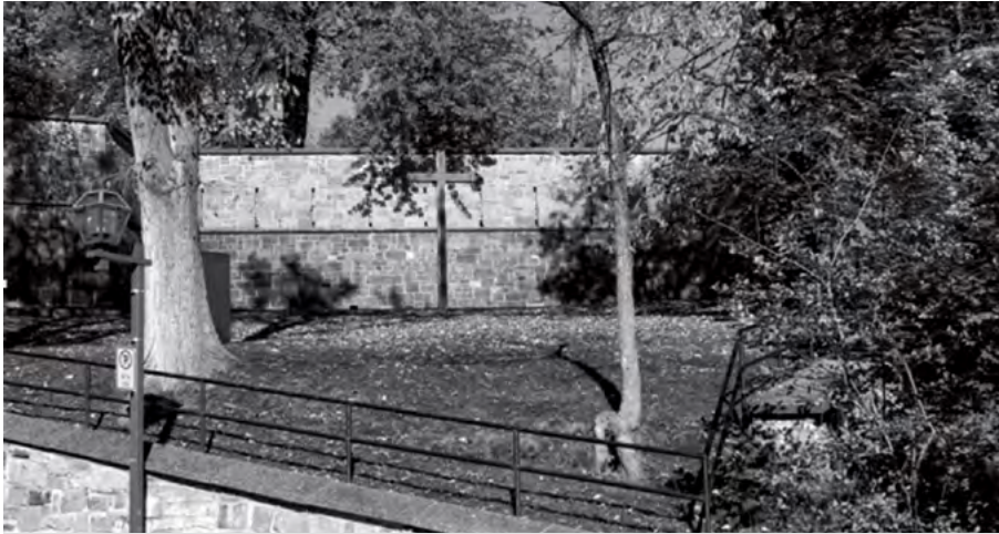
Site du premier cimetière de Québec, côte de la Montagne.

tement, mais le laisse dans une agonie plus ou moins longue selon les auteurs. Cette agonie serait aussi le sens qu'il faut donner à la « maladie » qui précède son décès selon le récollet Sagard et son confrère Le Clercq, à sa suite.