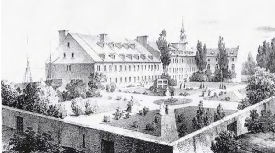
Vue du monastère de l'Hôpital Général de Québec, à Notre-Dame des Anges / D'après un daguerréotype de L. A. Le Mire; Lith de F. D'Avignon [vers 1855]. (Coll. Yves Beauregard).