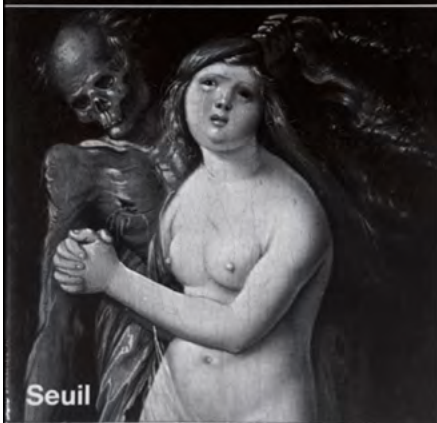
Philippe Ariès. Essais sur l'histoire de la mort en Occident. Paris, Seuil, 1975, 222 p.

premiers habitants de Québec ont immigré avec l'univers mental propre aux Français du XVII e siècle. Ils ont le même culte de la tradition, le même esprit de résistance face au découragement, la même peur de l'ennemi qu'il soit Anglais ou Iroquois et la même spiritualité dominée par le catholicisme issu de la contre-réforme. Ainsi, la mort d'Hébert, en 1627, est complètement différente de celle que nous vivons de nos jours. Dans notre société postindustrielle, la mort est complètement individualisée et est devenue presque tabou. Le deuil est évacué comme non productif et la mort a été reléguée hors de la vie. Au contraire, pour Hébert et ses contemporains, la mort est un événement communautaire. Le mourant est dans sa maison, de préférence dans son lit. Le rituel des derniers sacrements est public : le mourant est accompagné de sa famille, de ses enfants, de ses amis et même d'Amérindiens; il sait qu'il va mourir et il accepte sa mort sans mélancolie. Cette attitude est qualifiée de mort apprivoisée par Philippe Ariès dans son Essai sur l'histoire de la mort en Occident publié en 1975. Cette mort apprivoisée est une continuité spirituelle de la vie et elle se vit en collectivité. Le mourant n'accorde pas la même importance au testament qu'aujourd'hui puisqu'il dicte ses der-