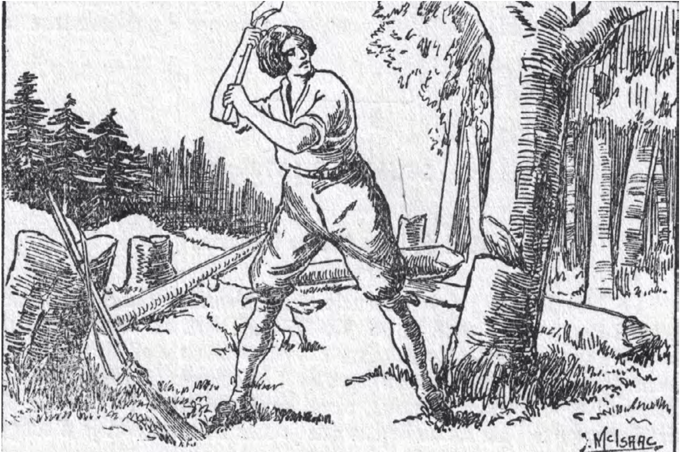
Louis Hébert. Illustration de J. McIsaac. (Hélie de Salvail. 366 anniversaires canadiens. Montréal, Frères des écoles chrétiennes, 1930. p. 39.