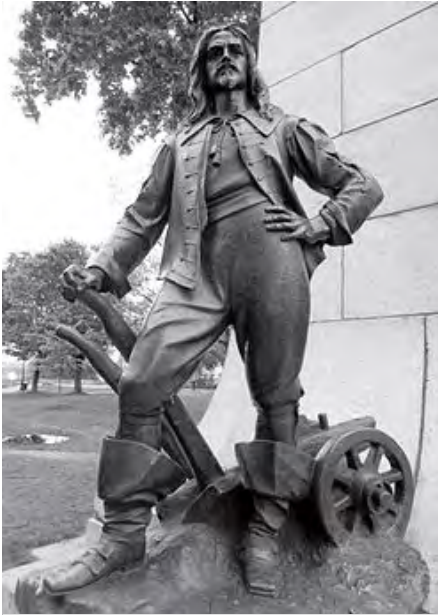
En 1617, la Ville de Québec rend hommage à Louis Hébert en lui érigeant un monument près de l'hôtel de ville (côté rue Sainte-Anne). Son gendre, Guillaume Couillard, est étroitement associé à cette reconnaissance.

Québec aux nouveaux époux. Après le décès de Louis, les Couillard vont reconstituer graduellement et en entier le fief d'origine en rachetant les portions appartenant aux autres héritiers de Louis Hébert. Jusqu'à son décès, en mars 1663, Guillaume poursuit la mise en valeur de toutes ses propriétés. Maintenant veuve, Guillemette se retire à l'Hôtel-Dieu où elle rend l'âme le 20 octobre 1684.