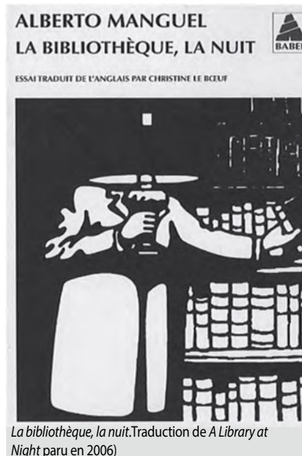
La bibliothèque, la nuit . Traduction de A Library at Night paru en 2006)

Fort de sa collection de 30 000 livres, Alberto Manguel affirme sans ambages : « Une bibliothèque n'est pas faite pour se