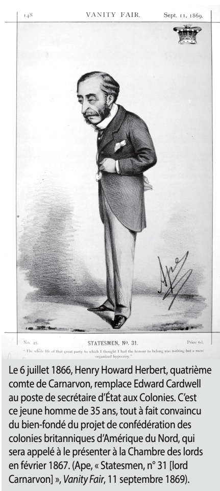
Le 6 juillet 1866, Henry Howard Herbert, quatrième comte de Carnarvon, remplace Edward Cardwell au poste de secrétaire d'État aux Colonies. C'est ce jeune homme de 35 ans, tout à fait convaincu du bien-fondé du projet de confédération des colonies britanniques d'Amérique du Nord, qui sera appelé à le présenter à la Chambre des lords en février 1867. (Ape, « Statesmen, n° 31 [lord Carnarvon] », Vanity Fair , 11 septembre 1869).