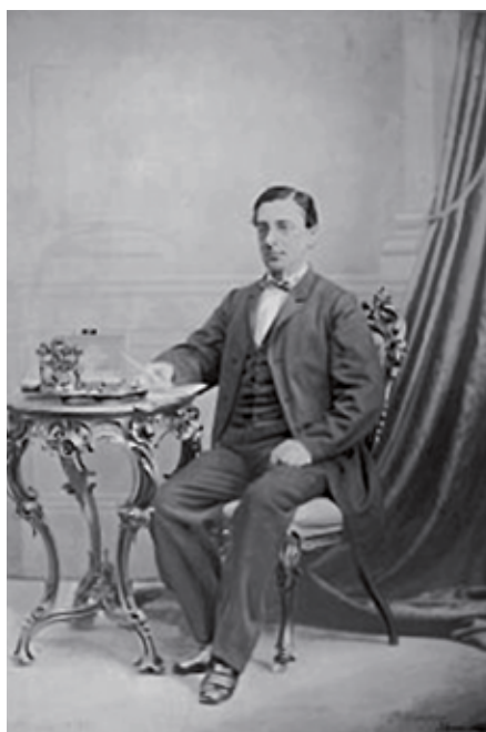
Antoine-Aimé Dorion (1818-1891).

Il faut se rendre à l'évidence, nous sommes à des années lumières de « l'esprit » de 1867. Les chercheurs qui se sont penchés récemment sur les événements ayant mené à l'adoption de l'Acte de l'Amérique du Nord britannique sont formels : le projet des Pères de la Confédération était éminemment conservateur, voire réactionnaire. La « peur-de-l'autre », cette faille morale impardonnable pour