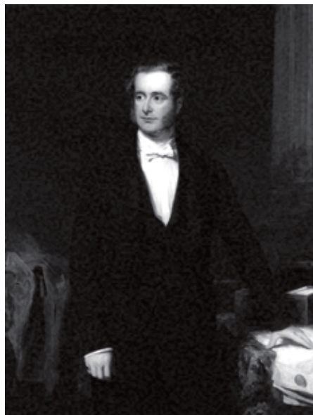
Henry Pelham Clinton, 5 e duc de Newcastle (1811-1864). Il fut secrétaire d'État aux colonies d'Angleterre de 1859 à 1864. Peinture de Frederik Richard Say. (National Portrait Gallery).

vateurs et une frange des réformistes du Canada-Ouest dirigé par George Brown, l'influent directeur du Globe . Tout porte à croire que le ralliement inattendu de ce dernier ait été direc-