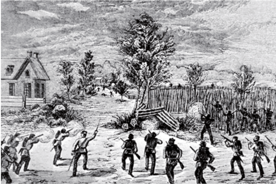
Cette gravure montre la bataille d'Eccles Mills opposant les fenians et le 50 e bataillon des Volontaires. ( https://en.wikipedia.org/wiki/Fenian_raids ).

la City, tels Thomas Baring et George Carr Glyn, lesquels suivaient de très près ce qui se passait au Canada. C'est que sur le plan économique, les liens entre ces colonies britanniques et la Grande-Bretagne étaient davantage financiers que commerciaux. Comme le montre Ged Martin, à peine 3 % des exportations britanniques étaient destinées aux colonies britanniques d'Amérique du Nord. En revanche, les capitaux investis par les banquiers et les financiers de la City dans la canalisation du Saint-Laurent et les projets d'infrastructures ferroviaires étaient énormes. Entre 1850 et 1859, le gouvernement du Canada aurait emprunté près de 100 millions de dollars. En 1866, 31 % des dépenses du budget du Canada était consacré au service de la dette – dette que l'on devait pour l'essentiel aux financiers britanniques. Ces mêmes financiers étaient également détenteurs d'obligations de nombreuses villes. Pour ces financiers, le lien impérial était primordial puisqu'il constituait une sorte de garantie que, tôt ou tard, ces prêts seraient honorés. Ces investissements étaient beaucoup plus sûrs que ceux consentis aux États américains dont certains, durant la crise éco-