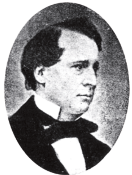
Louis-Victor Sicotte (1812-1889), avocat, juge et homme politique. ( https://en.wikipedia.org/wiki/Louis-Victor_Sicotte ).