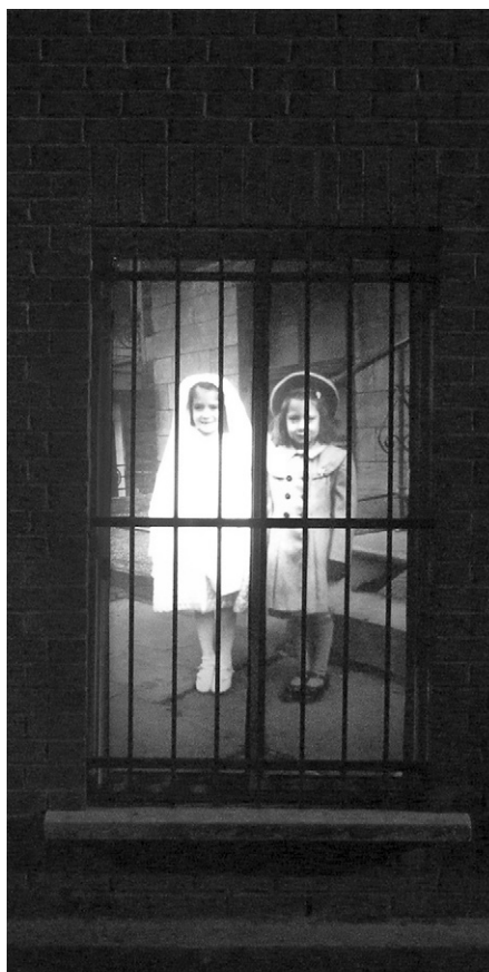
Loren Williams, 3669A, ruelle Saint-André / de Mentana (Le soir / At Night). Laterna magica , installation in situ , 24 septembre au 10 octobre 2010, Montréal. http://www.lorenwilliams.com/x-fr-accueil.html .

L'exposition présentée à Montréal sur l'avenue McGill College en 2013 visait à rappeler le triste sort des d'enfants ayant grandi dans des pensionnats autochtones et à faire réfléchir quant à la mission de ces institutions qui visait à les déposséder de leur culture. Pour atteindre cet objectif, et faire ce « devoir de mémoire », l'exposition était organisée autour de 24 photographies en noir et blanc provenant de différents centres d'archives. Chacune des images reproduites en grand format sur les panneaux d'exposition était accompagnée d'informations relatives à son origine ainsi que d'une légende servant à établir les faits et surtout les méfaits de cette vaste