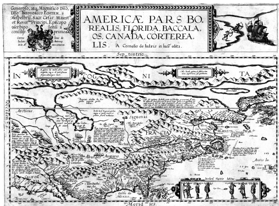
Americae Pars Borealis de Cornelis de Jode, 1593. Le passage du Nord-Ouest est très nettement représenté. Cette carte est chargée d'informations. En haut à droite, le cartographe évoque l'attaque dont fut victime Frobisher. Sur la côte atlantique, il rappelle l'épisode de Laudonnière et Ribault. Ce dernier fut traîtreusement mis à mort par Pedro Menéndez, l'émissaire de Philippe II. Jode multiplie les emprunts et prend plaisir à s'inspirer de John White et de Le Moyne de Morgues.