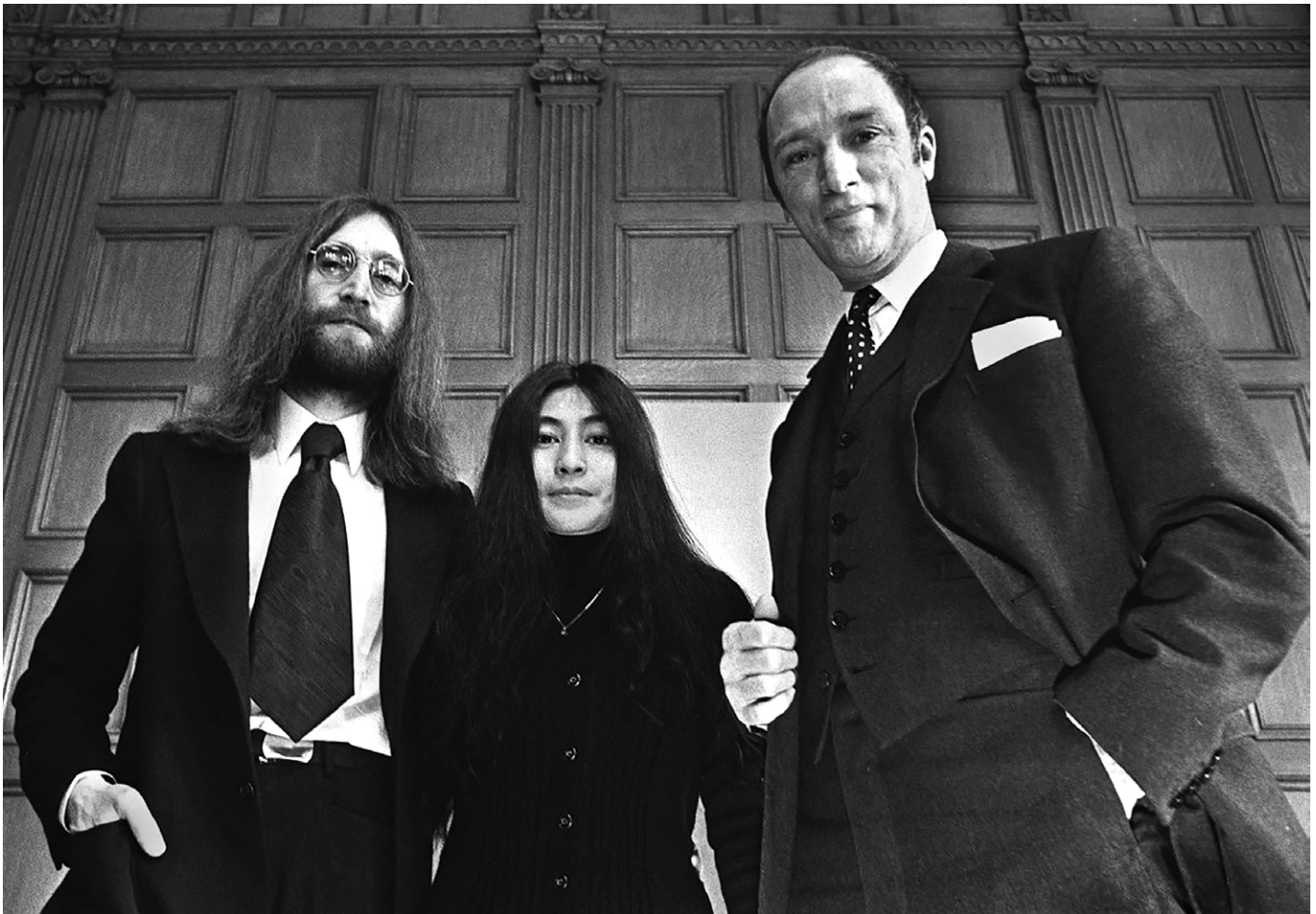
« Durant leur campagne mondiale pour la paix, en décembre 1969, John Lennon et Yoko Ono rencontrent le premier ministre du Canada, Pierre Elliott Trudeau ». Photo : Peter Bregg/The Canadian Press File Photo (1969). Source : Toronto Star Newspaper Ltd. (Illustration disponible à l'URL : https://www.thestar.com/news/canada/2013/12/01/why_canada_banned_pot_science_had_nothing_to_do_with_it.html )

manes et les effets physiologiques des médicaments. Il inclut un manuel de premiers soins pour le traitement des utilisateurs de drogues, manuel expédié à tous les médecins du Canada, mais contesté par plusieurs comme une atteinte à la profession médicale. Il faut ainsi comprendre que, pour produire pareilles études, la Commission Le Dain se composait de beaucoup plus que de cinq commissaires. Dès le début des travaux, James J. Moore agit comme secrétaire permanent de la Commission. Il est en poste jusqu'à l'automne 1972 alors que Frederick Brown le remplace. De plus, la Commission est dotée d'un personnel à temps plein et de chercheurs sous contrat afin de réaliser 120 projets de recherche. Les sujets