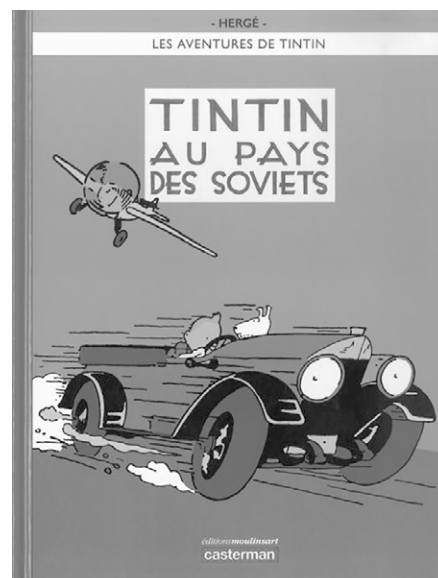
Hergé. Tintin au pays des Soviets . Paris et Louvain, Éditions Moulinsart et Casterman, 2017, 137 p.

à première vue de le confondre avec tant d'autres ouvrages lui étant consacrés si ce n'était de son contenu abondamment illustré. Ce catalogue imposant constitue un beau souvenir de la grande exposition de 2016 au Grand Palais, à Paris. Beaucoup d'éléments de cette exposition se sont rendus au Musée de la civilisation de Québec, mais pas tous; nous les retrouvons ici. La qualité de cette édition sous reliure rigide nous ravit : reproductions en grand format, esquisses, planches crayonnées, documents inédits, projets