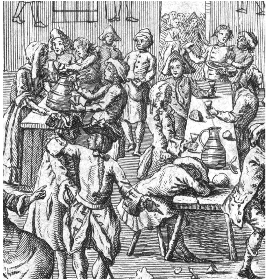
Vue de l'intérieur du Cabaret du Tambour-Royal tenu par Ramponneau (détail). (Bibliothèque nationale de France, QB-370 (7) - FT 4).

point crainte, n'est-ce pas précisément parce qu'un des risques encourus par la femme « ivre morte » est de perdre sa vertu, et même de concevoir un enfant hors mariage? Les archives judiciaires regorgent d'exemples où, ayant trop bu (et trop ouvertement), la femme ivre