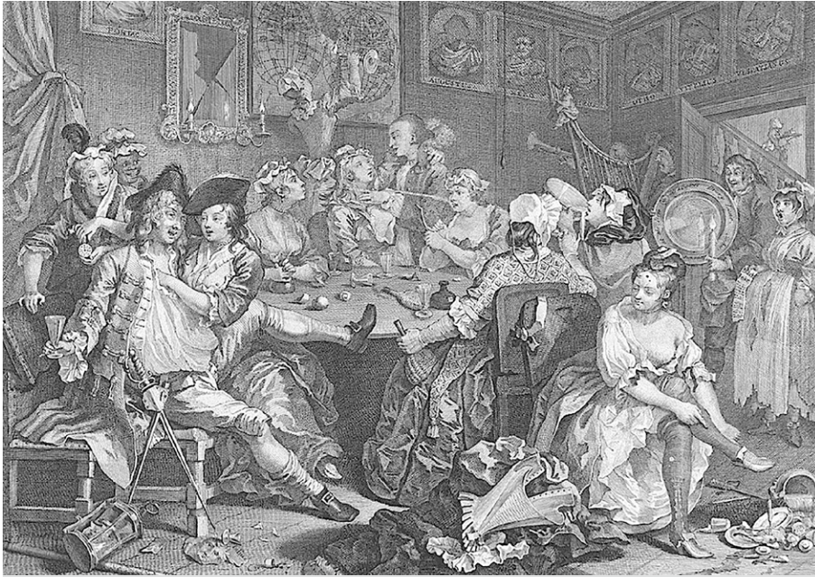
William Hogarth, «La Taverne», gravure, 1735.