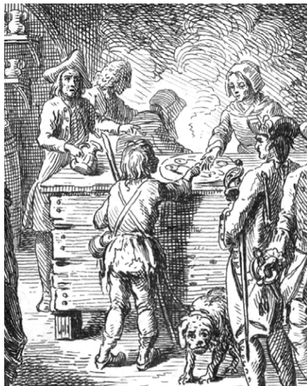
Vue différente de l'intérieur du Cabaret du Tambour-Royal (détail).