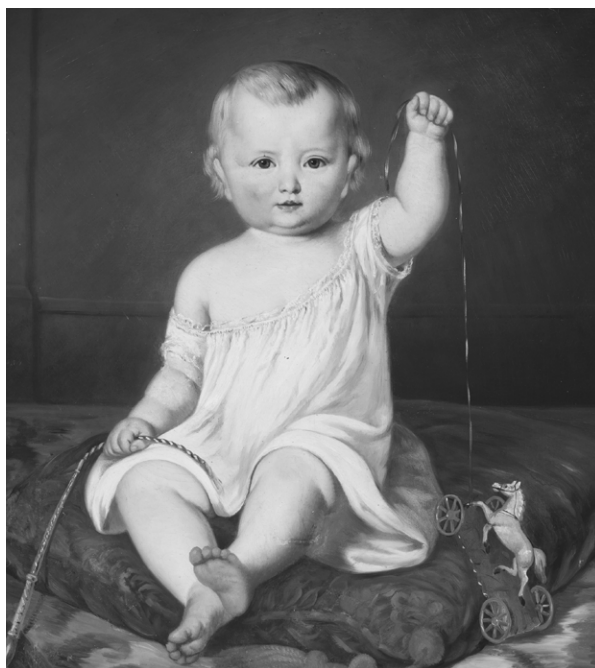
Théophile Hamel (Sainte-Foy, 1817 - Québec, 1870), Ernest Hamel, neveu de l'artiste, 1854 ; paraphé et daté au centre, à gauche : T.H. 1854; huile sur toile, 72,3 x 64,3. Achat, MNBAQ, 1955.694.