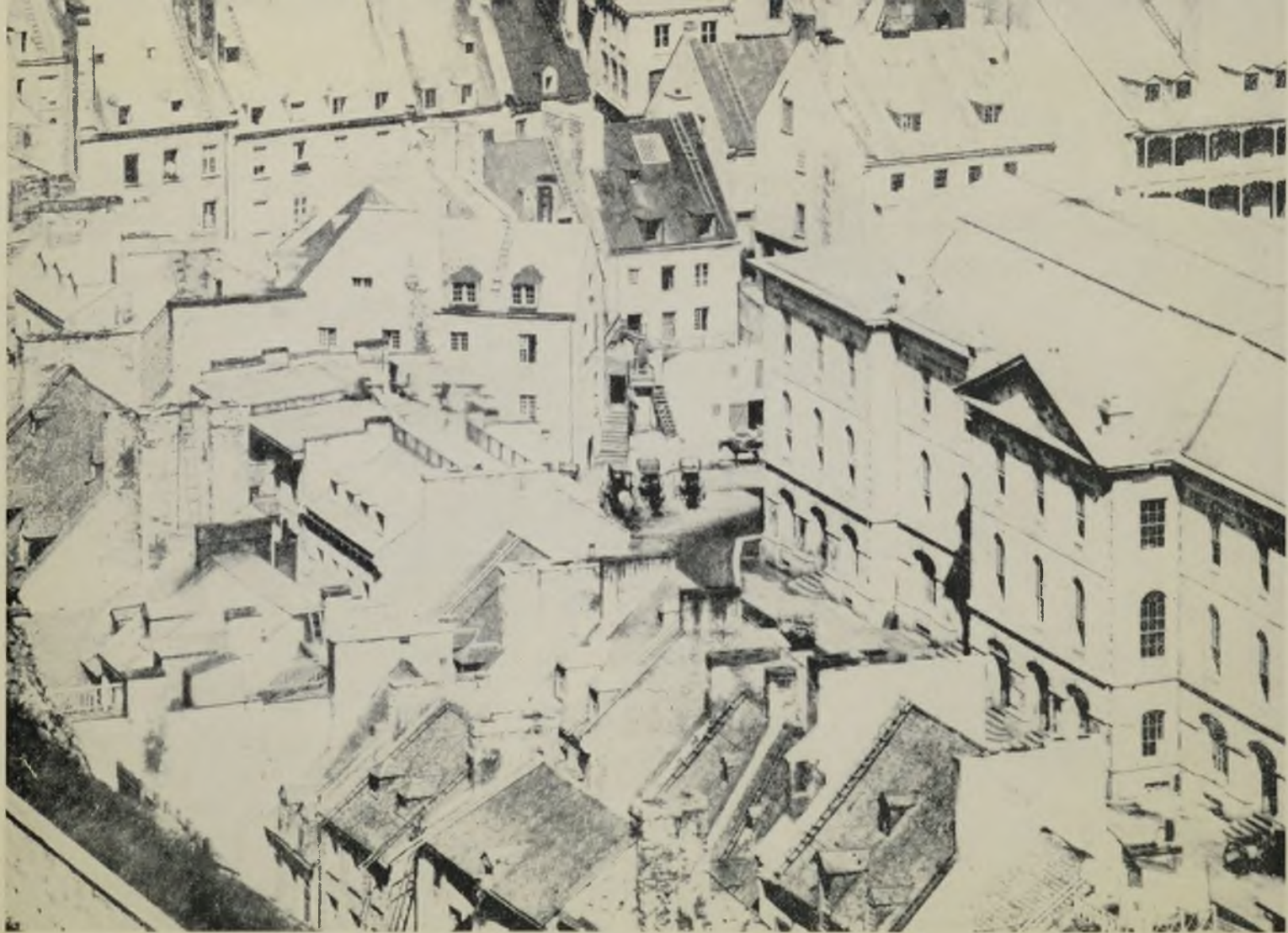
Fragment d'une photographie de la Basse Ville prise vers 1878 par Prudent Vallée : au centre, on distingue très nettement le côté sud et l'arrière de la maison Chevalier, le toit de la maison Pagé, le toit et l'arrière de l'ancienne maison Bertrand de la Chesnaye.