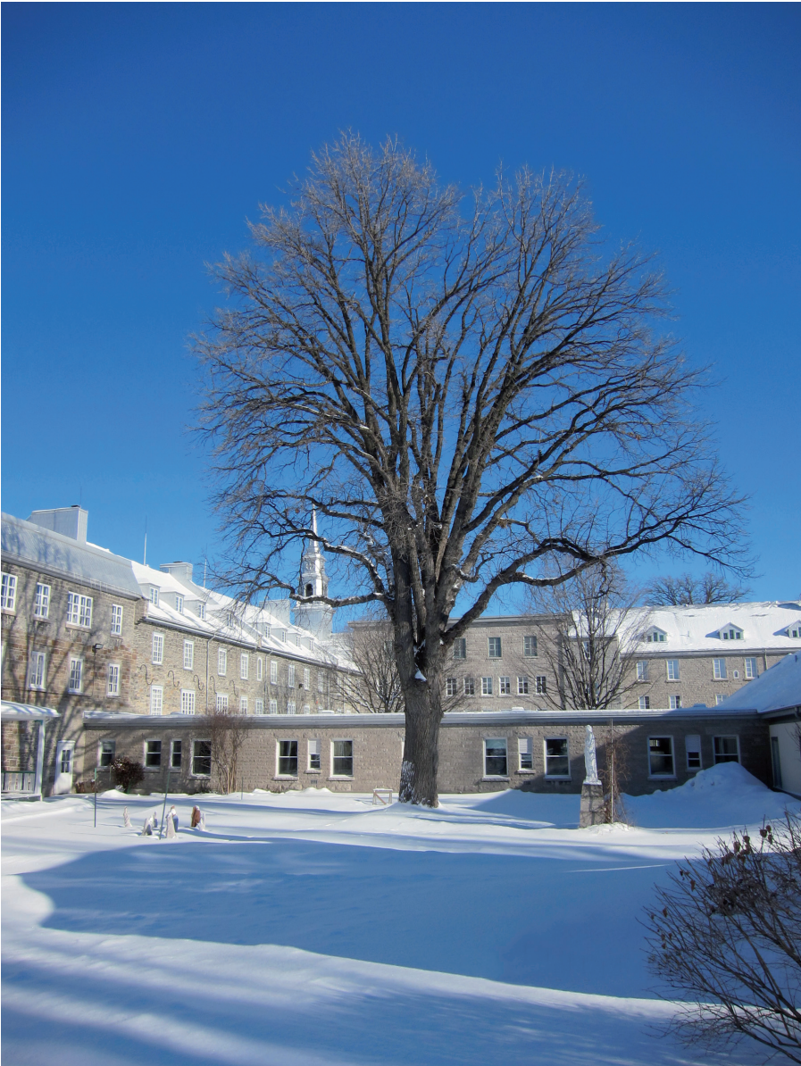
Un des chênes centenaires de l'Hôpital Général de Québec.