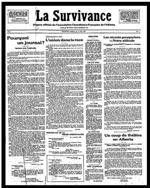
Figure 1a 1 e page du 1 er numéro du 27 novembre 1928 de La Survivance : l'image est absente pour la majorité des premières pages pendant plusieurs années.