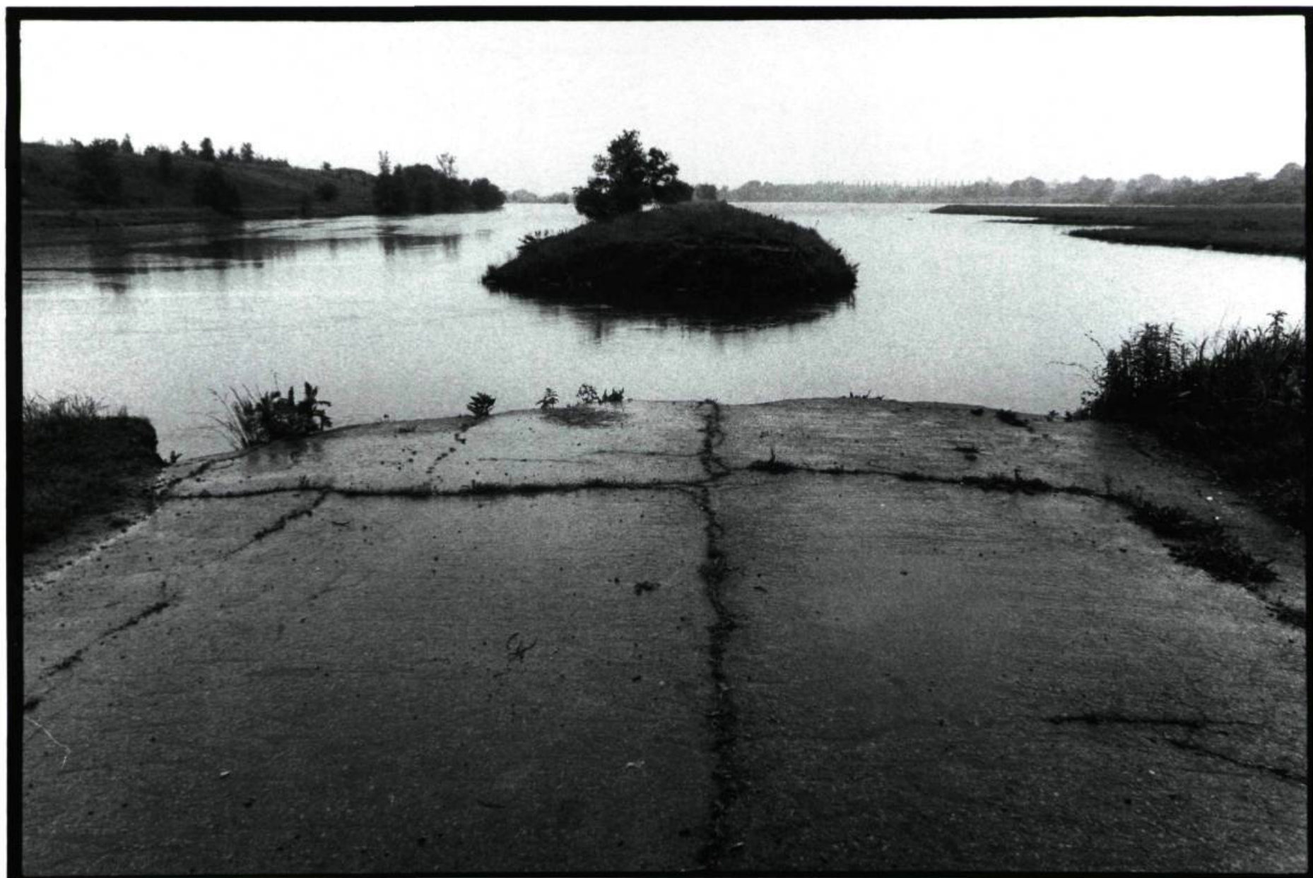
PIERRE CRÉPÔ Photo de repérage pour le film de Jean Chabot, VOYAGE AVEC UN CHEVAL EMPRUNTÉ