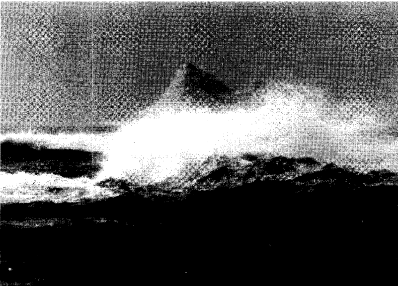
Avant le jour (Lucie Lambert, 1999) La crispation formelle du paysage, s'irréalisant dans la blancheur de l'hiver, vient communier avec la douleur exprimée par les mots. Photographie de plateau, collection personnelle