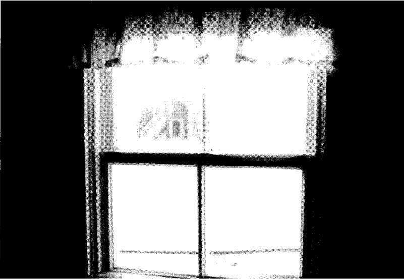
Avant le jour (Lucie Lambert, 1999) Quand le regard-paysage vient au secours des mots pour faire entendre leur silence. Photographie de plateau, collection personnelle