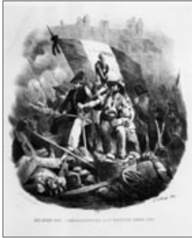
Figure 6 Charbonnier et maître chez lui (Bellangé, 1830)