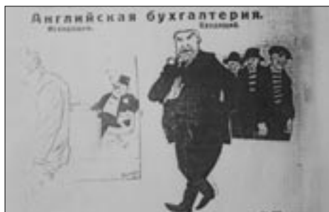
Figure 14 Dessin de Moor, Pravda (28 novembre 1923)

Dans Octobre aussi, les reprises de caricatures récentes sont nombreuses. Par exemple, pour bâtir la fuite de Kerenski, Eisenstein et son équipe reprennent tout simplement un dessin paru en janvier 1927 dans la Pravda , intitulé « Le chemin du socialisme » et montrant Macdonald qui s'échappe dans une voiture décapotable (figure 16). Eisenstein s'est contenté de