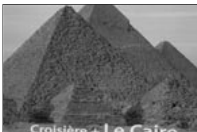
Figure 3 Brochure touristique (automne-hiver 1997)

de Louxor 6 , j'ai voulu savoir si ces deux tragédies avaient ou non affecté les représentations traditionnelles des pyramides. Pour ce faire, je me suis procuré les brochures déjà éditées par les principales agences de voyage françaises (séjours automne-hiver 1997) et je les ai comparées, trois mois plus tard, aux nouvelles livraisons (printemps-été 1998 7 ). L'iconographie n'était plus la même. Aux pyramides prises en plans larges et aux habituelles sculptures de Karnak et de Louxor, les tour operators avaient substitué le sphinx — meurtri — en gros plan (figure 4) et les cariatides d'Abou Simbel (figure 5). Cette modification suscite, bien sûr, des interrogations. Est-elle irréfléchie ou consciente? Est-elle ou non spécifiquement française? Photographes et/ou commanditaires ont-ils pensé que les vues précédentes n'étaient plus acceptables ou étaient-ils seulement las de cette imagerie? Le changement sera-t-il durable? Les professionnels du tourisme offriront-ils dans quelques années les deux types de photos concurrentes?