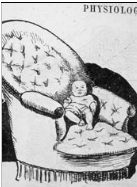
Figure 18 Dessin anonyme, L'Éclipse (1 er juillet 1877)