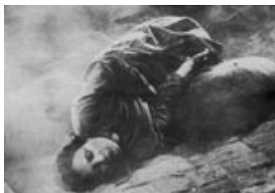
Figure 12 La Nouvelle Babylone (Kozintsev et Trauberg, 1929)

bure — dont les proches avaient été victimes d'un attentat, la « Vierge à l'enfant » est un cliché qui continue de faire florès. Au lendemain de la révolution d'octobre, Eisenstein et Dovjenko reprennent eux aussi cette figure dans leurs films, mais pour la désacraliser. Octobre présente, baignant dans une douce lumière, la statue de Rodin Les Premiers Pas . Mais, immédiatement après, par recadrages — truqués — en gros plans, nous voyons successivement le visage d'un enfant Jésus qui louche et sa jambe grasse derrière laquelle apparaît une petite locomotive-jouet. Ultérieurement, nous découvrons, dans la chambre de la tsarine,