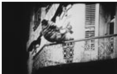
Figure 9 La Nouvelle Babylone (Kozintsev et Trauberg, 1929)