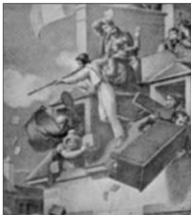
Figure 10 Les Assiégés (Bodem, 1830)