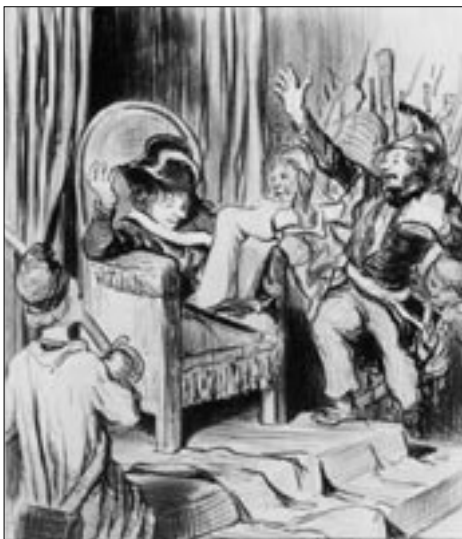
Figure 17 Gamin des Tuileries (Daumier, 1848)