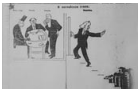
Figure 15 Dessin de Moor, Pravda (15 janvier 1924)