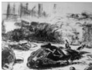
Figure 11 La Guerre civile (Manet, 1871)