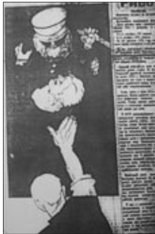
Figure 13 Dessin de Moor, Pravda (8 novembre 1923)

Beaucoup de plans de La Grève sont des copies conformes de portraits charges parus dans la Pravda avant le début du tournage. Le 8 novembre 1923, le quotidien publie le croquis d'un policier qui a saisi l'enfant d'un prolétaire pour le tuer (figure 13). Dans le film, un policier à cheval agrippe la petite fille d'un gréviste et la jette dans le vide. Le 28 novembre, Moor dessine un chef d'entreprise ventripotent, coiffé d'un gibus, qui s'enfume avec un gros cigare et refuse de recevoir une délégation de travailleurs (figure 14). Cet individu grotesque, assis à son bureau dos d'âne, deviendra le patron de La Grève . Le 15 janvier 1924, le même artiste montre, accompagné de la légende « Dans le style anglais », Macdonald, le roi Georges et deux quidams