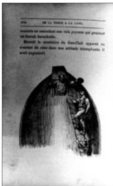
Figure 1 De la Terre à la Lune (Jules Verne, 1907)

L'enquête généalogique est bien sûr vouée à l'échec. Comment retrouver le document original — estampe, description littéraire ou chose vue — qui conditionne notre regard, nous