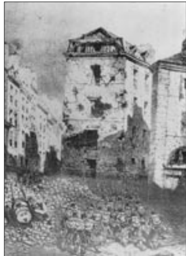
Figure 8 Attaque de la barricade, place de la Bastille (25 juin) (Beaumont et Cicéri, 1848)