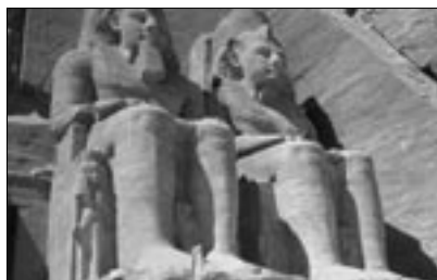
Figures 4 et 5 Brochure touristique (printemps-été 1998)