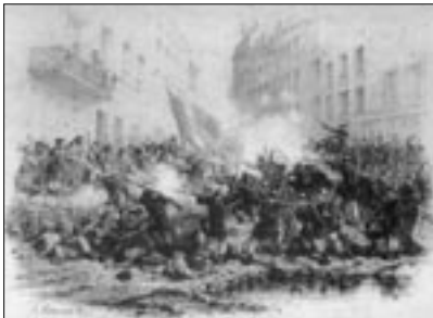
Figure 7 Souvenirs de juin 1848, le 24 juin 48. Prise de la barricade de Ménilmontant (Lehnert) Musée d'Art et d'Histoire de Saint-Denis